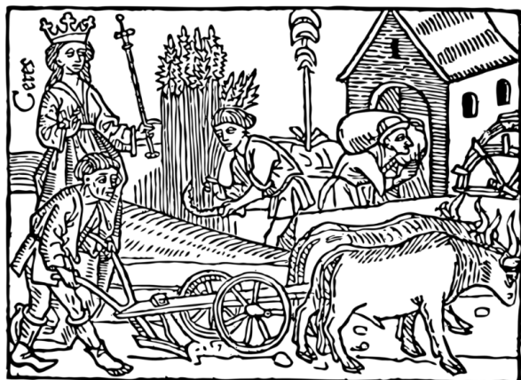
"The Decorative Illustration of Books" by Walter Crane c1896.