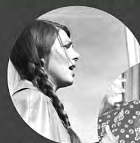
SPECIAL GUEST: FRANKIE ARMSTRONG (DK)