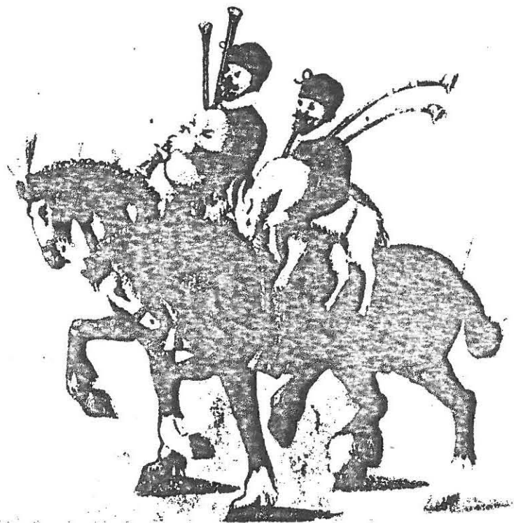
117: Altenburger Bauer mit Großem Bock