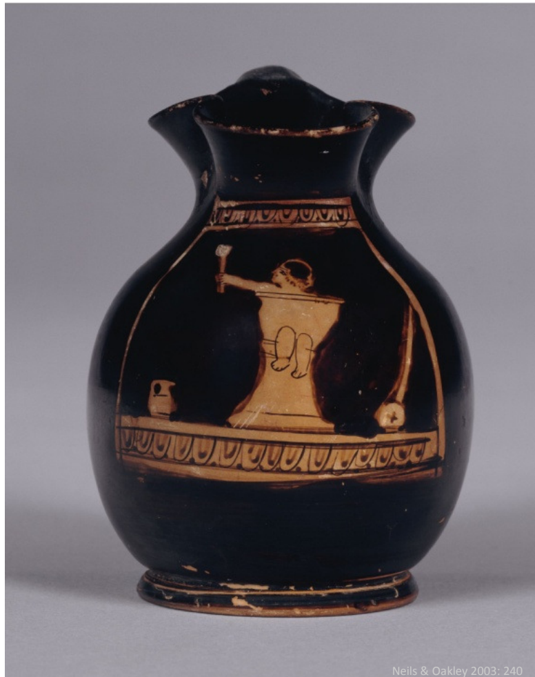
Fig. 1: Attisk rødfigurs-chous med barn på en pottestol med rangle

Figur 1 afbilder et spædbarn siddende på en pottestol med en rangle i hånden; barnet sidder i en 'aktiv' stilling med udstrakt arm og stirrer på ranglen (eller måske en umalet voksen-person?). Som set på figur 1 var ranglen af en størrelse, så barnet selv kunne lege med den; andre typer var for store og tunge til at barnet kunne lege med legetøjet (fig. 2). I