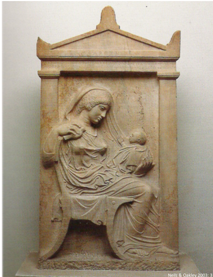
Fig. 7: Ampharete-stelen – Attisk gravstele fra sen 5. årh. f.v.t.

Gravsteler fra den klassiske og hellenistiske periode indikerer ligeledes emotioner for børn. Ampharete-stelen fra Kerameikos i Athen fra sen 5. århundrede f.v.t. viser en bedstemoder med hendes barnebarn. Indskriften viser tydeligt bedstemoderens sorg over barnebarnets død (Indskrift: se Neils & Oakley 2003: 3).