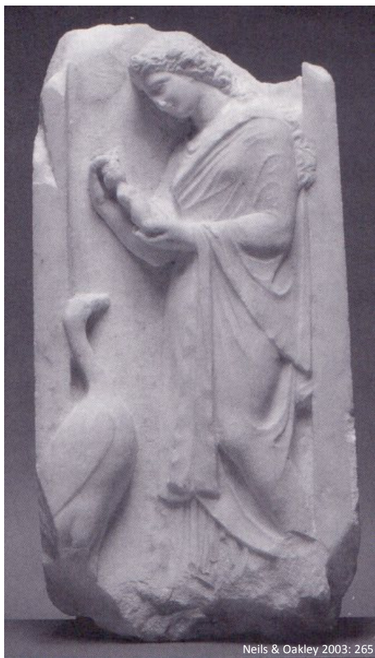
Fig. 5: Attisk gravstele med ung kvinde med en dukke, ca. 360 f.v.t.

Dukkernes funktion er ikke klar, men eftersom relativt mange findes i grave, også børnegrave, må det indikere, at de blev anvendt som legetøj. Fremstillinger af børn med dukker, bl.a. på gravsteler, kan måske fortælle om dette er tilfældet (fig. 5). Dukker fundet i helligdomme indikerer en rituel kontekst; unge piger/kvinder ofrede deres dukker til forskellige gudinder dagen før deres bryllup. Artemishelligdommen i Brauron er et eksempel (her blev der også afholdt den sakrale arkteia festival, hvor unge kvinder udklædte sig som bjørne), og ritualet var et transitionsritual fra barndom til voksenalderen (Sourvinou-Inwood 1988). Dukker virker til at have haft flere funktioner, f.eks. en rituel, apotropæisk eller sekulær funktion, og de kunne have fungeret som votivgaver, transitionsofringer, samleobjekter, legetøj til voksne etc. Men blev dukker brugt som legetøj af børn? Gravsteler afbilder børn i forbindelse med dukker; ofte er det unge piger, som holder en dukke i sin favn, eller også rækker et spædbarn armene frem mod en voksen, som holder en dukke i sin hånd (Neils & Oakley 2003: cat. 124, 1 er et andet eksempel på en sådan stele).