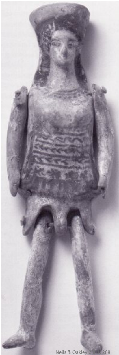
Fig. 3: Korintisk terrakottadukke fra tidlig 5. årh. f.v.t.