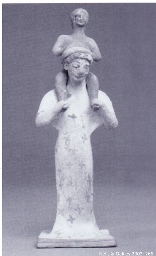
Fig.6: Boiotisk terrakottafigurine fra senarkaisk tid

Denne figurine, som afbilder en kvinde med en dreng, der får en ridetur på hendes skuldre, er meget sjælden. Barnets køn er vist ved kroppens røde farve – en typisk kønsindikation i arkaisk tid. Figurinen måler H. 15,3 cm. og B. 5,25 cm, hvilket svarer til dukkernes størrelse. Kvinden har sine hænder om drengens fødder, så han ikke falder af. Drengen sidder i en opret position med hans hænder på hovedet af kvinden. Ansigtsudtrykket på kvinden indikerer et smil, hvilket måske også ses hos drengen, og som viser at dette er en glædelig interaktion. Selvom det ikke kan ses ud fra denne figurine pga. dens statiske komposition, er rideture på skuldrene en aktiv leg, hvor den voksne løber og hopper rundt med barnet. Figurinen afbilder et intimt øjeblik i det græske hushold (Neils & Oakley 2003: 266).