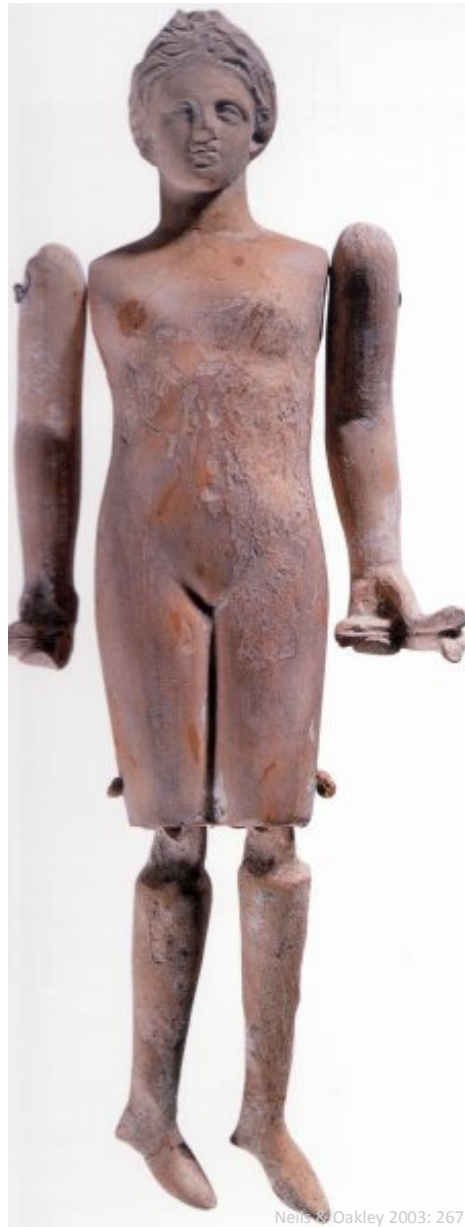
Fig. 4: Attisk terrakottadukke fra midten af 4. årh. f.v.t.

Figur 3 er en terrakottadukke fra Korinth af den ledløse type fra tidlig 5. århundrede f.v.t. Dukken er en kvinde og bærer en chiton med resterne af rød maling, som viser tekstildekoration. Dukken har haft langt sort hår og en hat er formet på hovedet. Dukken har senarkaiske træk med perlekrøller og store øjne. En lignende dukke, dog uden rester af maling, er fundet i Boiotien og er fra midten af det 5. århundrede f.v.t. (Neils & Oakley 2003: 268, fig. 74). Dukker af denne type fra tidlig- og midt 5. århundrede er fundet flere steder på Attika og på resten af det græske fastland (Elderkin 1930: 461). Dukken måler H. 12,3 cm og B. 5 cm.