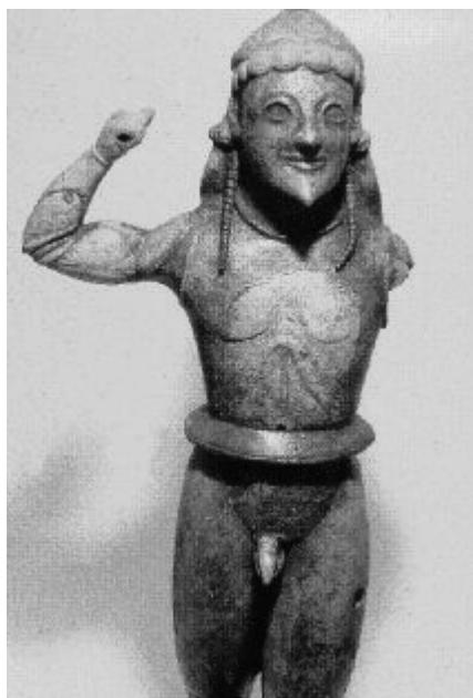
Fig. 3 Apollo hoplites statue