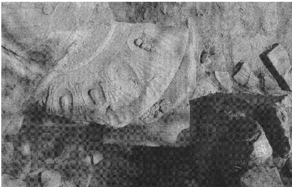
Fig. 2 Kapitæl