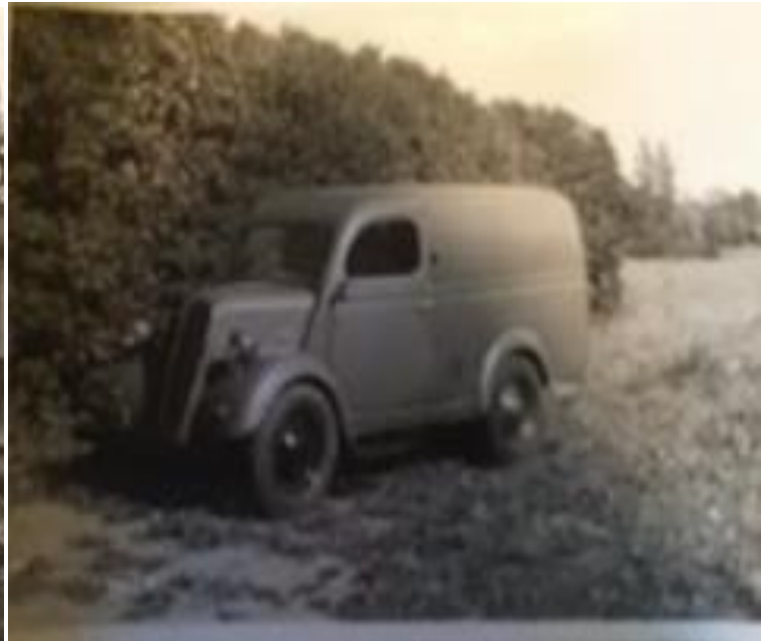
Den gamle Ford. Parkeret foran den nu meget omfangsrige syrenhæk.