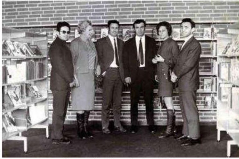
Besøg fra Jugoslavien 1971