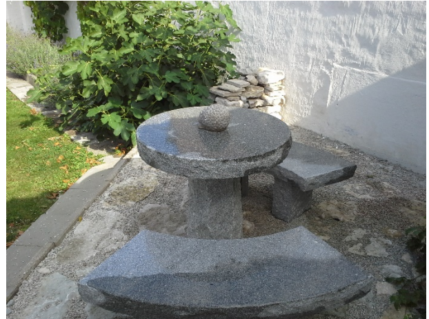
Stenbord med bänkar