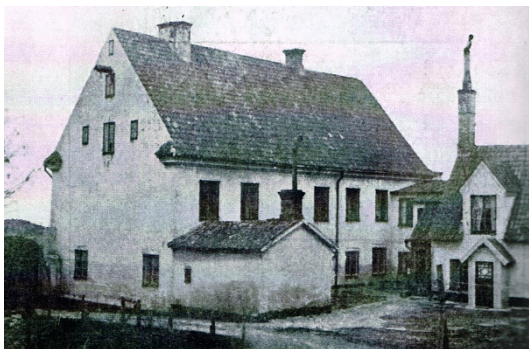
Nedre gården vid förra sekelskiftet

Sedan föreningen inhandlade tomten av konsul Kinberg 1892 har stora förändringar skett. I de tidiga åren fick renovering och skötsel av fastigheterna komma i första hand, och tomtytorna var mera att betrakta som gårdsplan med uthus. Planer har dock funnits att bygga ett lusthus utanför teaterlokalen, men detta projekt blev aldrig av.