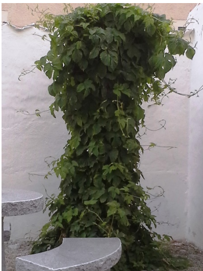
Humle Humulus Lupulus