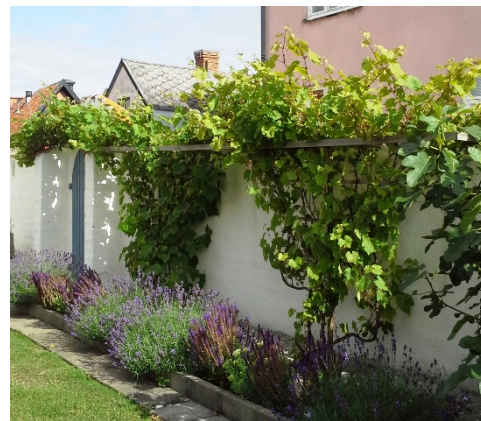
Vinrankor några år senare