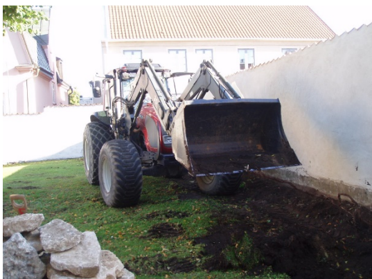
Anläggning ny rabatt påbörjad