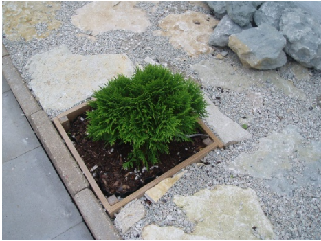
Tuja Thuja occidentalis Danica