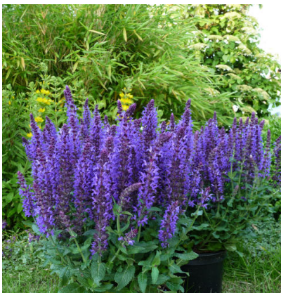
Stäppsalia Salvia Nemorosa L