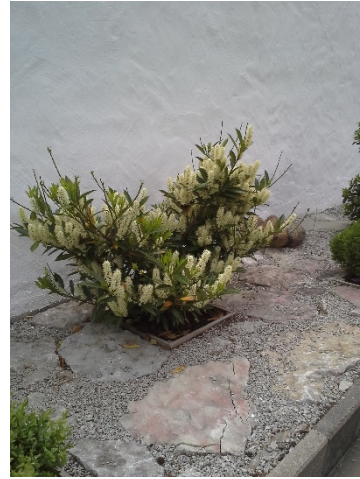
Lagerhagg Otto Luyken Prunus laurocerasus