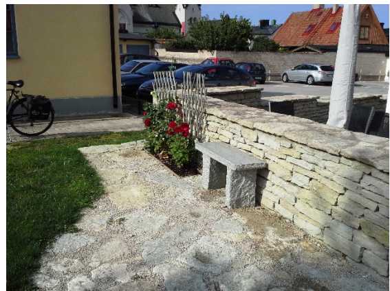
Stenbänk med grillplats