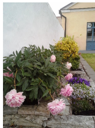
Luktpion "Sara Bernhardt" Paeonia lactiflora