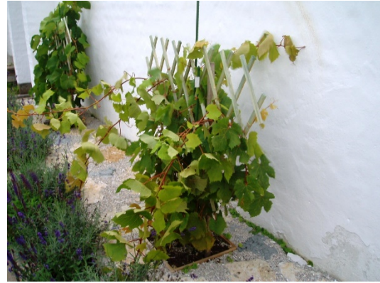
Vindruvor Vitis Labrusca, Himrod