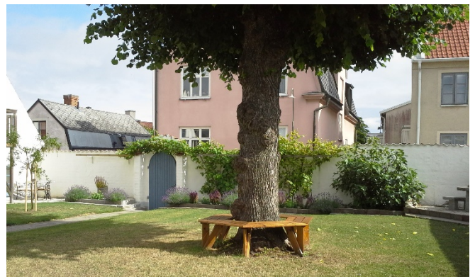
Vy mot nordväst