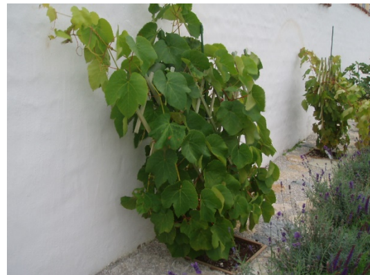
Vindruvor Vitis Labrusca, Vanessa