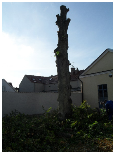
Linden klappas ner