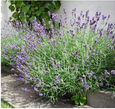
Lavendel Lavandula Angustifolia