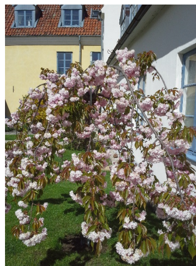
Japanskt Körsbärsträd Kanzan