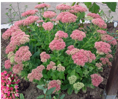
Sedum Sedum Spectabile Brilliant