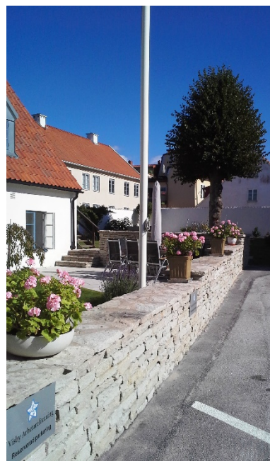
Vy mot övre gården. Nya stenvallen

lokalen, och deras arbete rönt stor uppskattning. Det är oklart om de även anlade rabatten mot Rydbergs tomt, och planterade de två träd som fanns i hörnet mot S:t Michaels gränd. Med tiden lämnades denna del av trädgården åt sitt öde, och inte minst murgröna tog över all annan växtlighet. Även de två planterade träden blev alltför stora, och rotsystemet hotade att underminera muren.