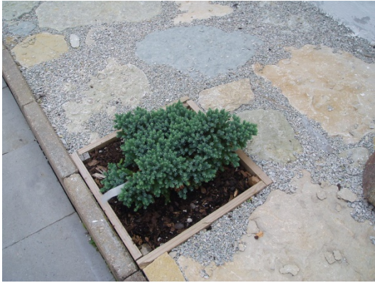
Himaljaene Blue Star Juniperus squamata