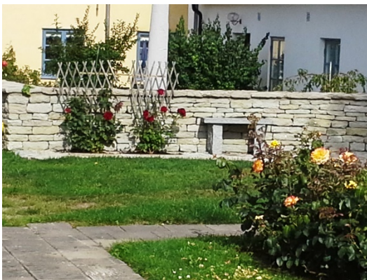
Rosor, Nadia Renaissance Claire Renaissance