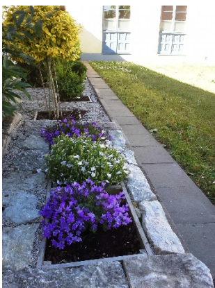
Murklocka Campanula portenschlagiana