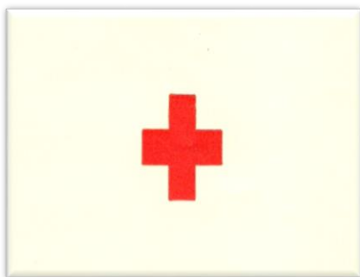
Røde Kors logo

Også asylcentrene i Danmark drives af Røde Kors. Det vil sige, at organisationen har ansvaret for asylansøgnernes ve og vel, mens deres sag bliver behandlet.