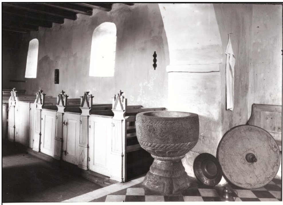
Interiør fra kirken

De fleste mennesker i Nøvling Sogn boede i mange år i den nordøstlige del af sognet. Her var der vand i åerne, her var den gode jord, så det var en helt naturlig ting, at man slog sig ned her og ikke i den sydvestlige del, der for en stor del var bevokset med lyng.