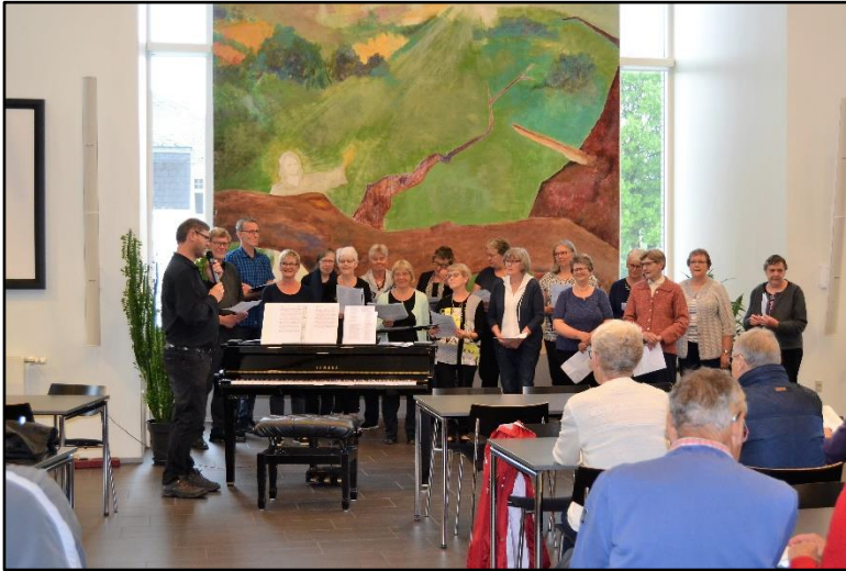
09. juni: I såvel ”Den Gule Bygning” som Kirkecentret var der åbent hus med bl.a. korsang af Vildbjerg Koret.