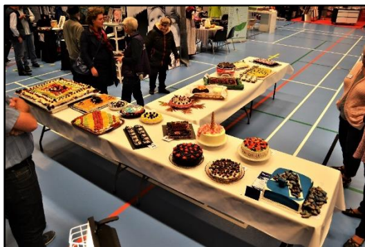
8. oktober: Lions Trehøje Lyngtotterne kunne igen glæde sig over en stor succes med Oktobermessen. De 84 stande i Vildbjerg Sports- og Kulturcenters to haller var udsolgt, og publikumsinteressen stor. Blandt nyhederne på årets messe var en bagekonkurrence, der havde deltagelse af

16 deltagere. To af kagerne bar præg af det kommende kommunalvalg, og en af dem i så høj grad, at den blev udelukket.