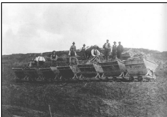
Tipvogne til mergeltransport