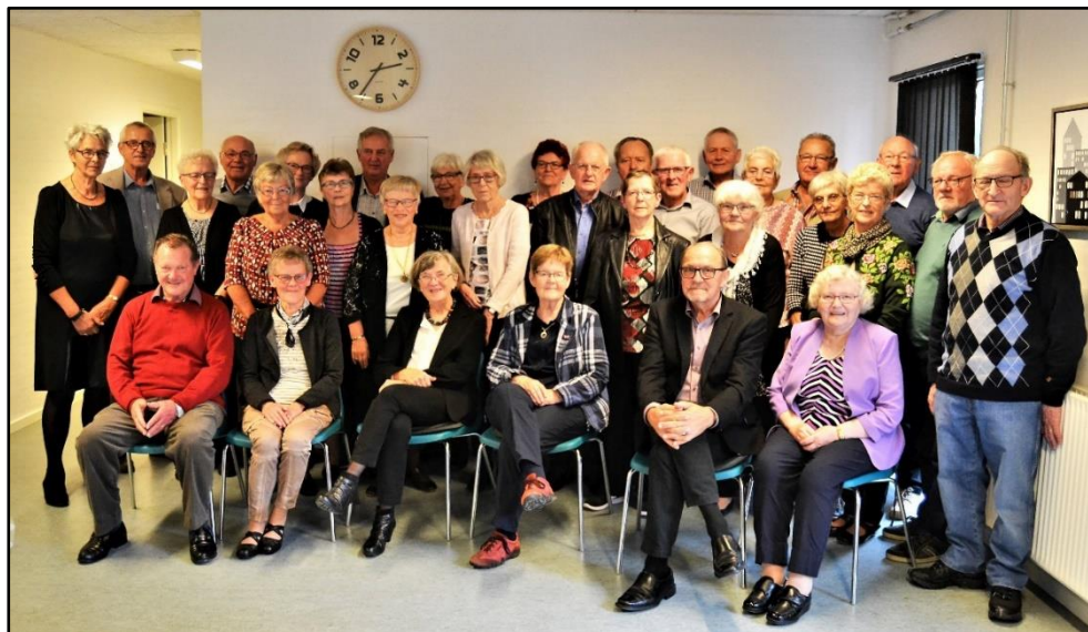
7. oktober: Igen i år samledes gamle elever fra Timring Skole i Timring Læringscenter. I alt deltog 31 elever fra årgangene 1953 – 1958 i festen.