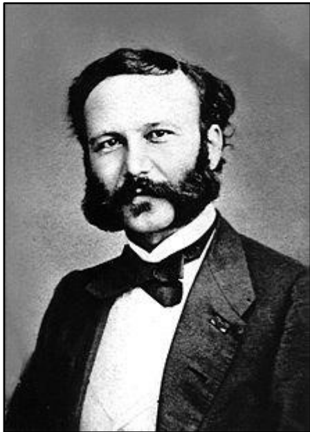
Henry Dunant 1828 - 1910

Formelt blev Røde Kors grundlagt på initiativ af schweizeren Henry Dunant ved en konference i Geneve 1863. Baggrunden for oprettelsen var hans