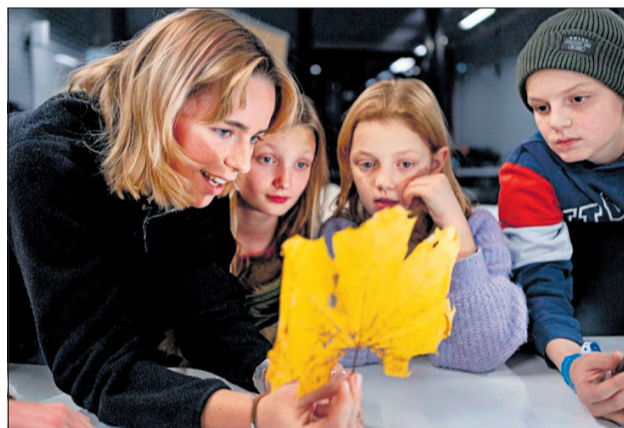
Frivillige gymnasieelever underviser de nysgerrige deltagere, der er elever på 4.-5. klassetrin i det gratis fritidstilbud fra Videnskabsklubben.

Tilmeldingen åbner søndag 20. august klokken 10 på Videnskabsklubbens hjemmeside.