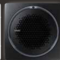
Black square panel