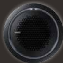
Black round panel