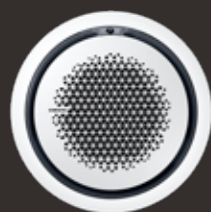
White round panel