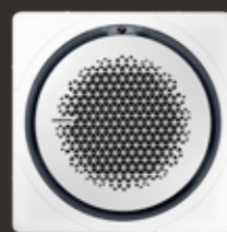
White square panel