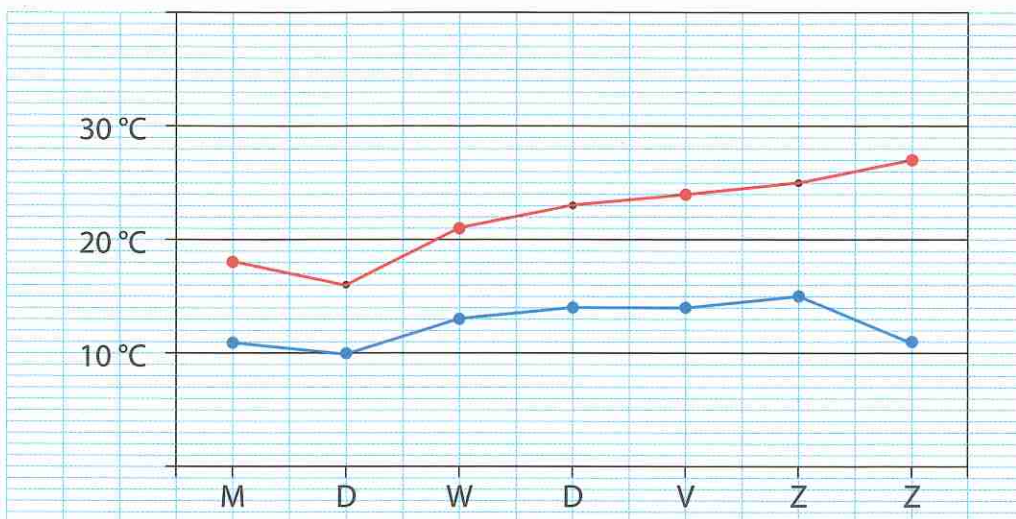
Temperatuur in Ukkel in de week van 25 tot 31 mei