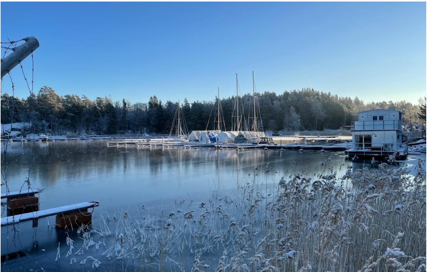
Bolvik hamn i vinterskrud.