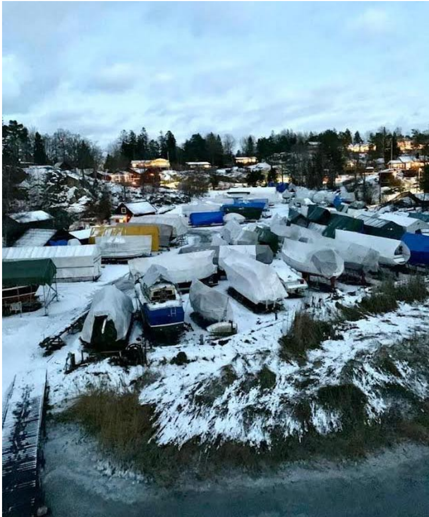
Torsby varv från mastkranens topp.