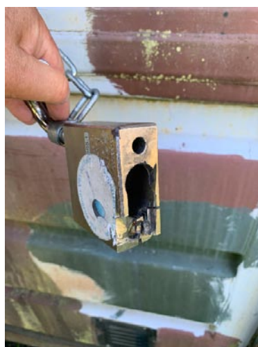
Trasigt lås till vår container. Tvungen att såga ut cylindern för att få bort och kunna byta låset.