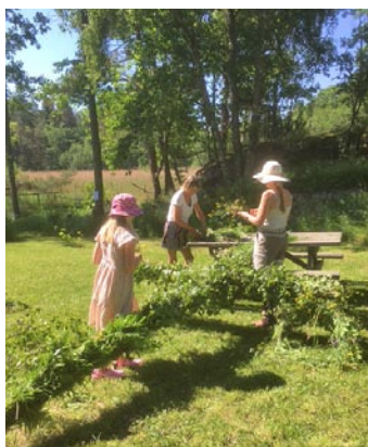
Påklädning av midsommarstången enligt traditionen, därefter blev det dans runt stången. "Gubbarna" verkar ha tagit siesta när det blev dags för dans.