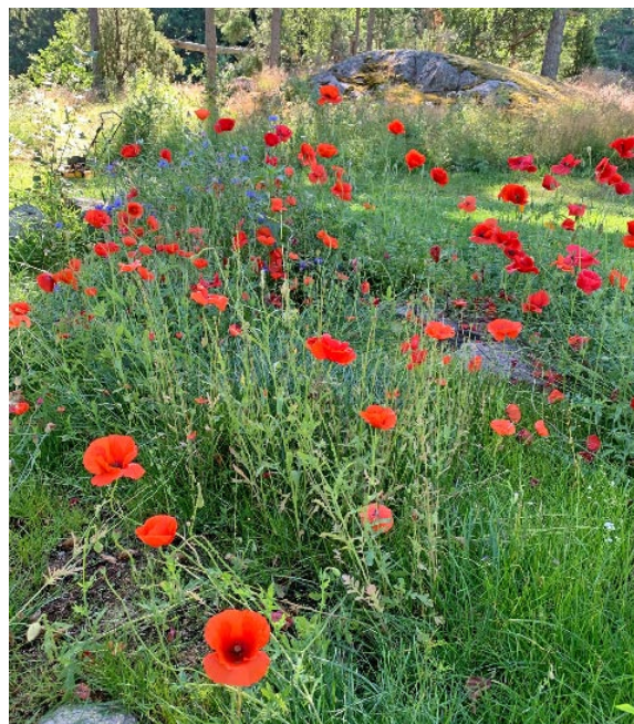
Påskliljor och Vallmoarrangemang är mycket uppskattade.