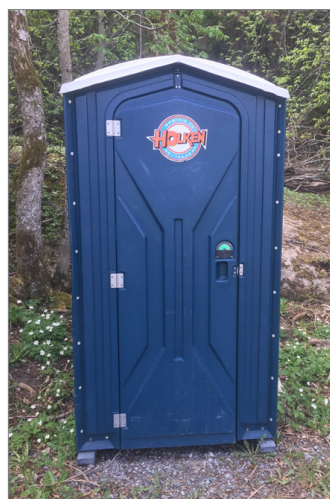
"HOLKEN" Inhyrd luktfri toalett. Uppskattat!