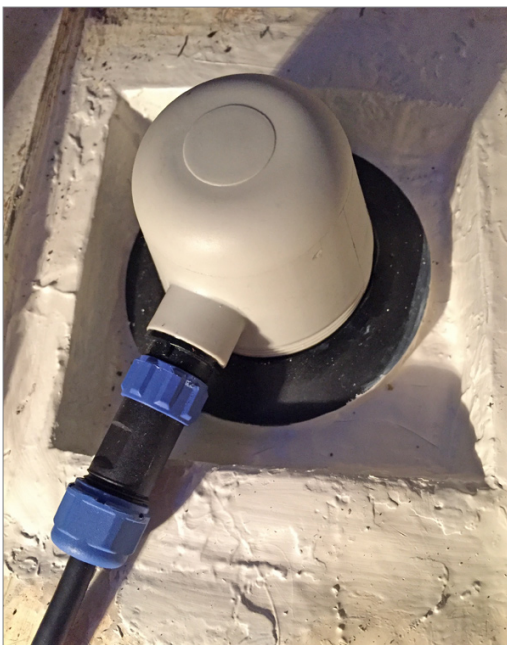
Sändarna i båten

http://ultrasonicantifoulingworks.co.uk/