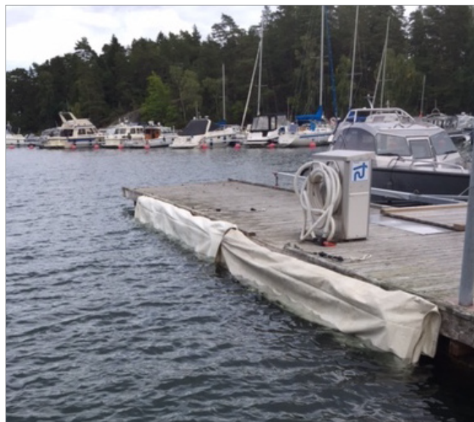
Toatömningsstationen är nu avfendrad.

Ny vaktkur med utsikt över hela hamnen är klar till 2018.