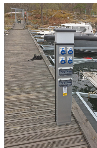
Elstolpar på samtliga bryggor.