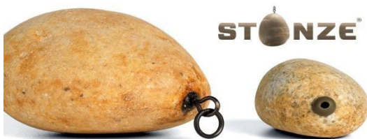
PALLATRAX STONZE: WWW.karperxl.nl