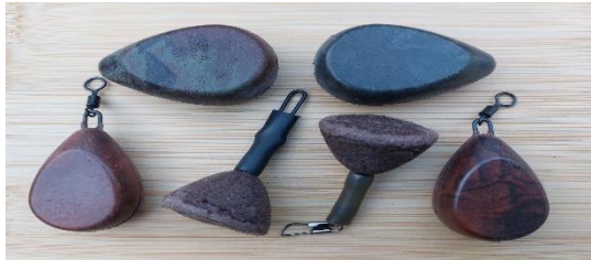
COMPOSITET: ijzer+biologisch afbreekbaar kunststof

LOOD EN LOODHOUDENDE PRODUCTEN ZOALS LEADCORE ZIJN SCHADELIJK VOOR MENS, DIER EN MILIEU. OM HET WATER EN ZIJN BEWONERS GEZOND TE HOUDEN KUNNEN WE BETER ZO SNEL MOGELIJK OVERSCHAKELEN NAAR LOODVRIJE ALTERNATIEVEN.