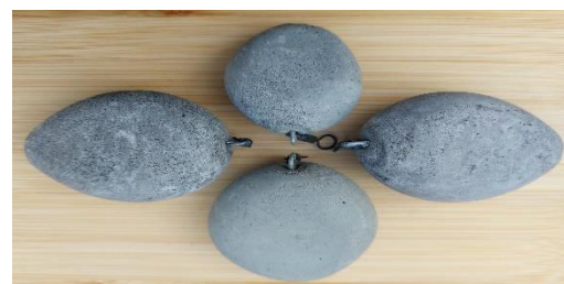
KARPER XL BETON: WWW.karperxl.nl