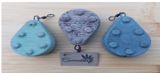
ECONCRETES: magnadense beton