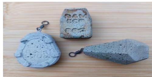
ECO SINKERS BETON: WWW.ecosinkers.eu