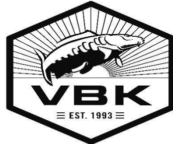
VERENIGING BELGISCHE KARPERVISSERS