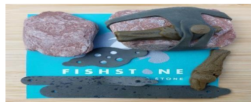
Bio afbreekbaar rubber WWW.fishstone.de