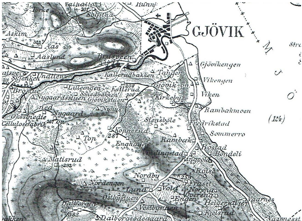
Kartet fra 1879 viser Rambekkmøens strategiske plassering på vegen mellom Gjøvik og Toten.

Rambekkmoen, gnr./bnr 59/11, var en husmannsplass under garden Rambekk. Den utgjorde en slette som hadde oppstått ved utløpet av Mobekken, som Caspar Hennig kalte den. Denne bekken dannet grensen mot vest og nord. Mot sør grenset Rambekkmoen mot gnr./bnr. 59/9 Nordre Rambekk. Strandområdet gnr./bnr. 59/14 var aldri en del av eiendommen Rambekkmoen idet det så sent som i 1931 ble utskilt fra gnr./bnr. 59/1, Søndre Rambekk. Da bruket kom på salg i 1878 ble det av avisannonsen kjent at arealet var på 50 dekar.