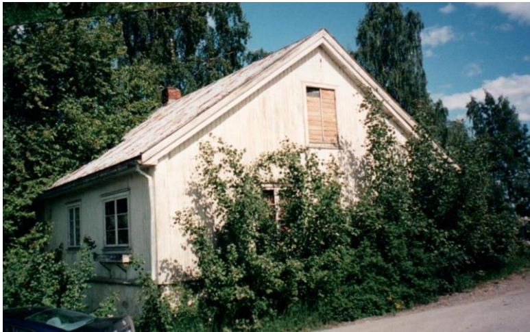
Rambekkstua i 1998

bodde han og drev garveriet til han kjøpte Rambekkmoen i 1822. Sannsynligvis har han fortsatt å drive garveriet her. Han giftet seg i 1823 og fikk to barn før han flyttet til Nedre Gjøvik mellom 1826 og 1828. I denne perioden kan han og familien ha bodd i den såkalte «Rambekkstua».