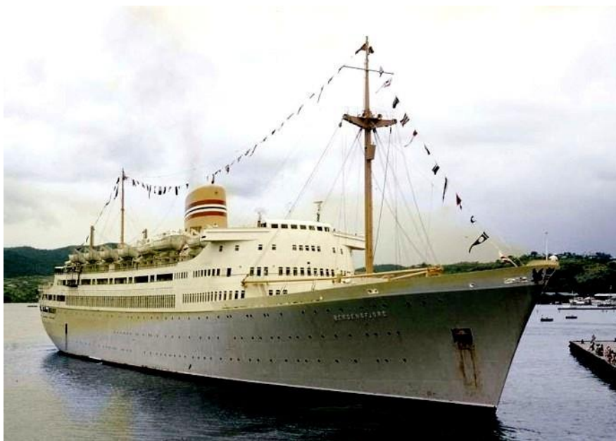
M/S Bergensfjord, bygget i 1956