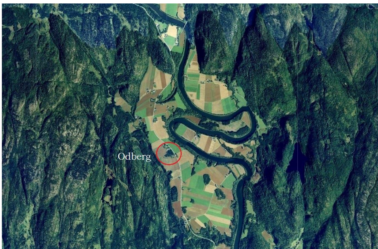
Odberg i Kvelde, nå i storkommunen Larvik