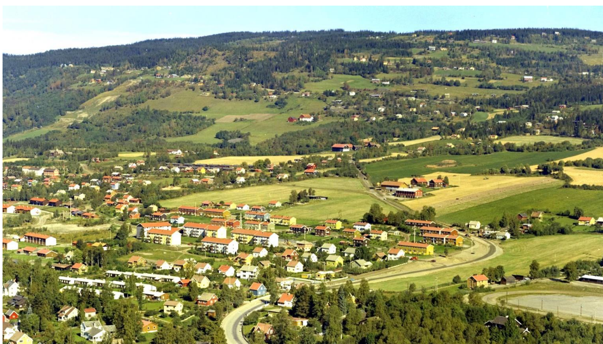
Randgård er den første garden ovenfor Lillehammer etter vegen mot Nordseter.