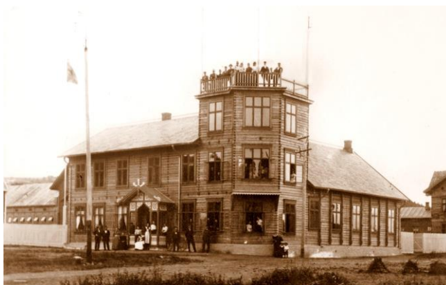
Ynglingen, slik huset så ut i 1899.