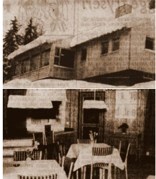
Samhold 1. mars 1954