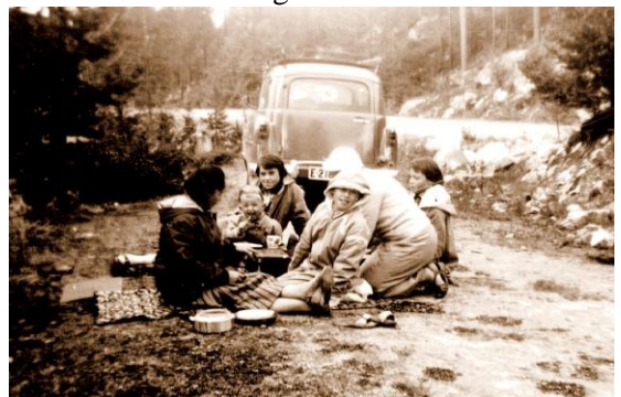
Middag under enkle forhold