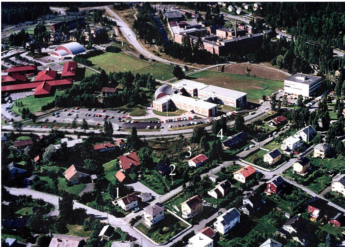
Øvre Tongjordet og Kallerud 1991. 1. Søndre Tangen, Alf Mjøensveg 2B, 2. Gamletangen, Kallerudbakken 1, 3. Pettersens hus, Kallerudbakken 3, 4. Solerud, Kallerudbakken 5