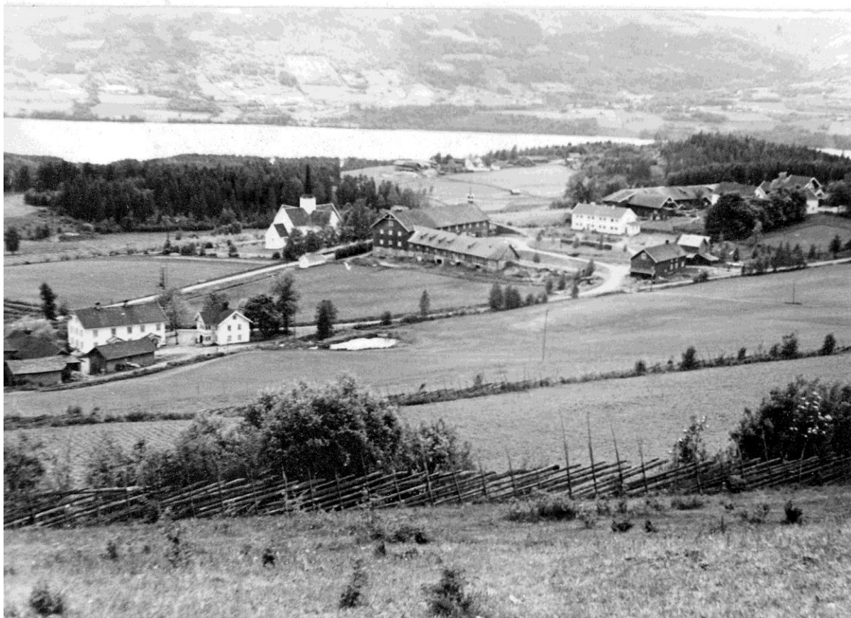
Fra Brøttum: Handelsstedet Rogne til venstre. Brøttum kirke med Mæhlum-gardene i bakgrunnen.