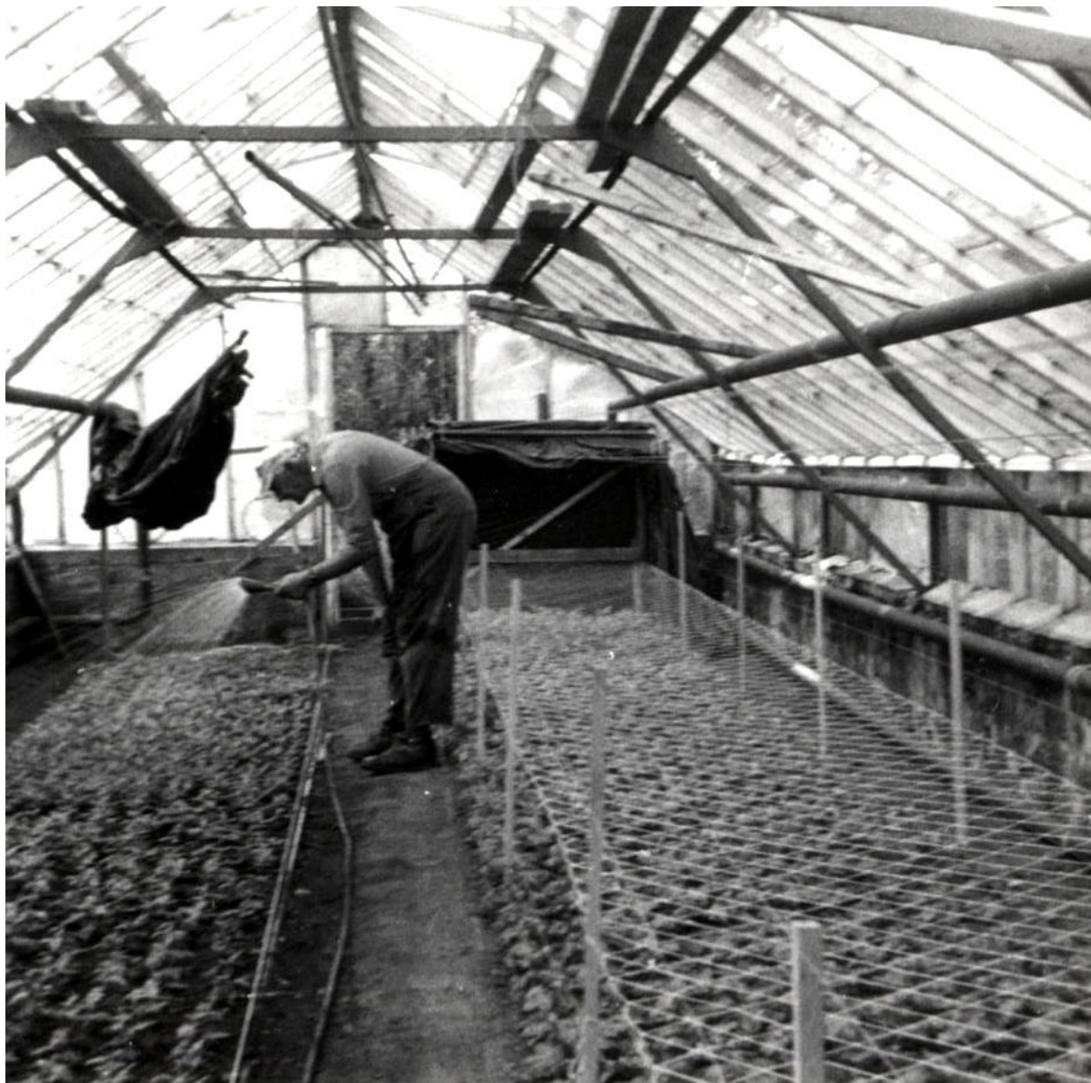
Sigmund Granvin i gartneriet