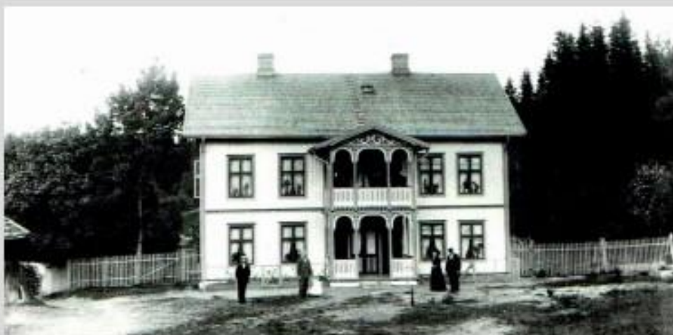
Våningshuset i Lilleengen