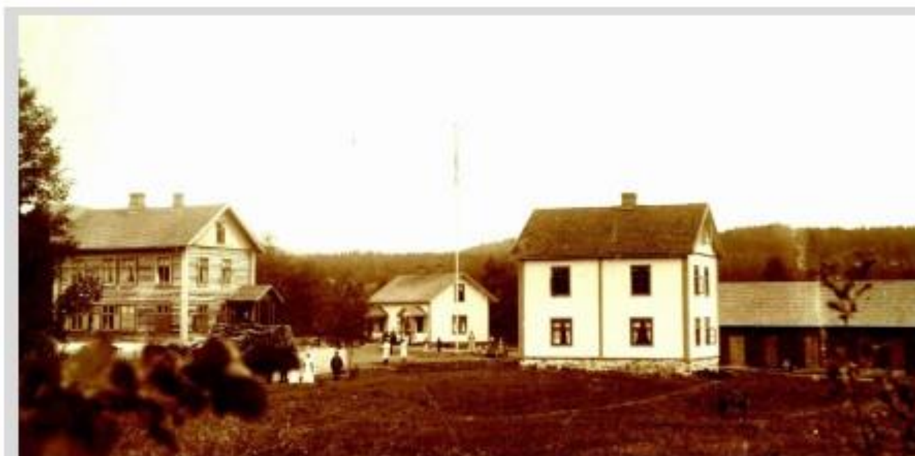
Til venstre Solvang under bygging i 1897/98. I midten Skredderstuen og til høyre bedehuset. Bedehuset var opprinnelig våningshuset i Nygårdsstuen. Det hadde én etasje og fikk i den påbygde andreetasjen et stort rom som ble kalt «Børresalen».

Med basis i den tilgjengelige vannkraften satte Børre på 1890-tallet i gang en rekke virksomheter. Den gamle vadmelsstampa ble revet og erstattet av en benmølle. Det ble også bygget et frørenseri for rensing av korn. Dette fikk tilbygd en sag som utnyttet samme vannhjul. En stor mølle med sju treturbiner ble tilknyttet den lange kanalen. På tunet til Nygårdsstuen ble det bygget en toetasjes bolig som inneholdt landhandel og kontor i første etasje.