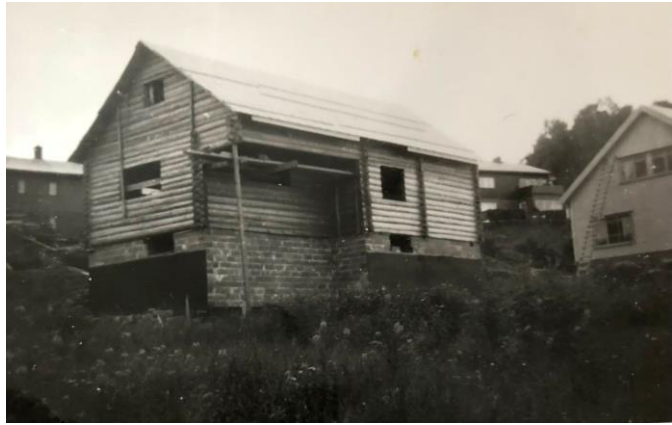
Hytta fra Kvamsfjellet under oppføring i Lundsgate i 1953.