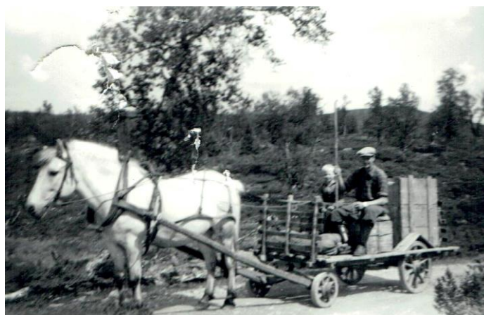
På tur hjem fra stølen i 1955