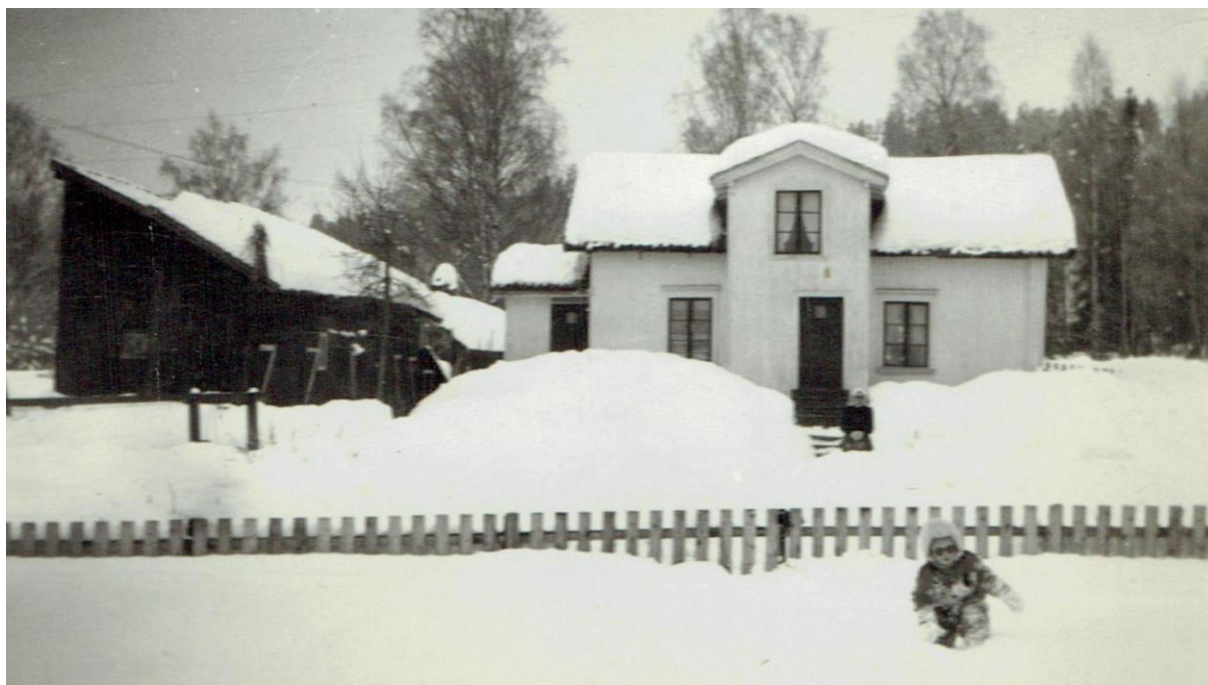
Haugen lå der hvor B-bygget for den tekniske skolen ble bygget i 1970.