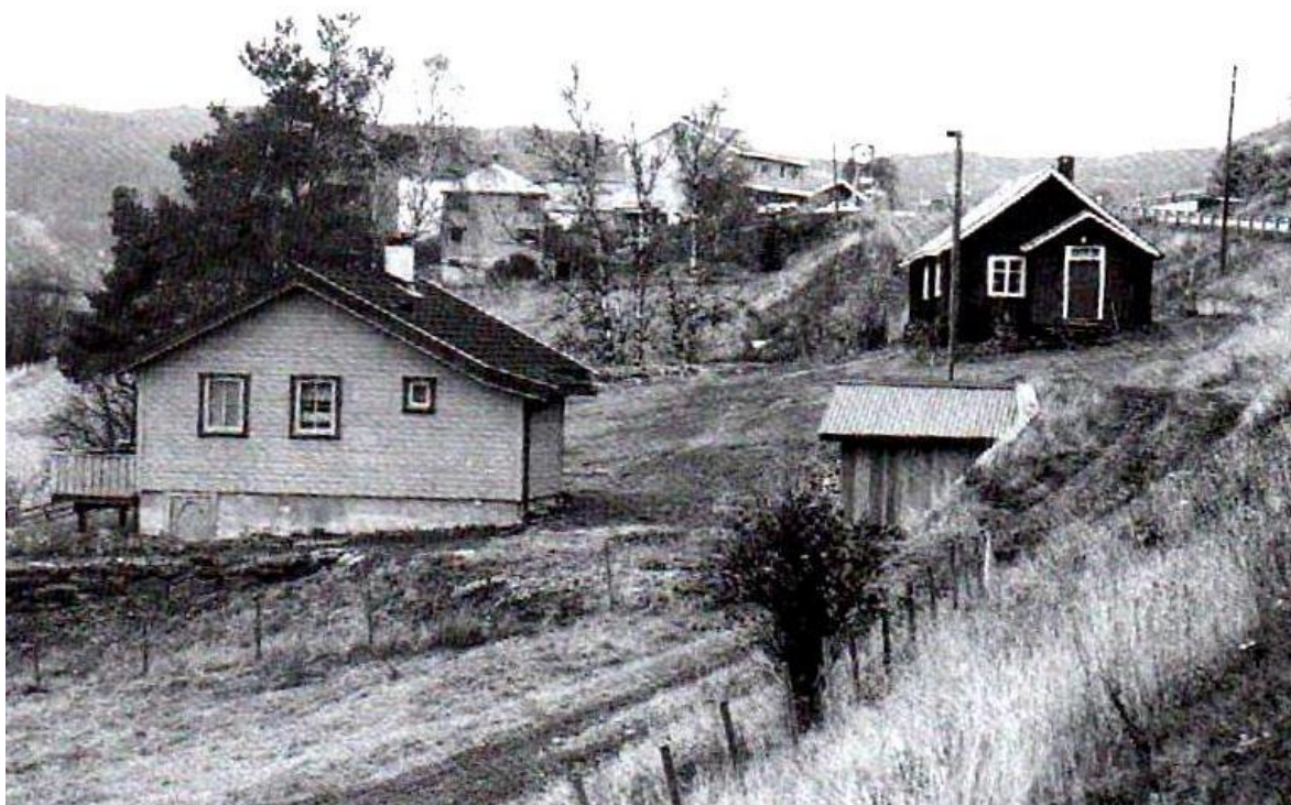
Melby i Rogne, Øystre Slidre hvor Astrid Ingvaldsen vokste opp, Hun var også eier av garden fra 1987.