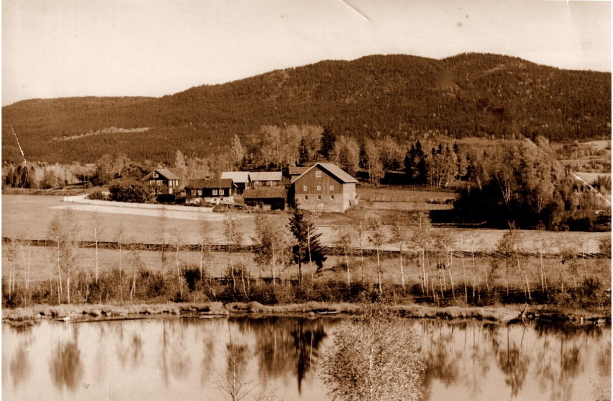
159/3 Tuv med Jorstadtjernet i forgrunnen