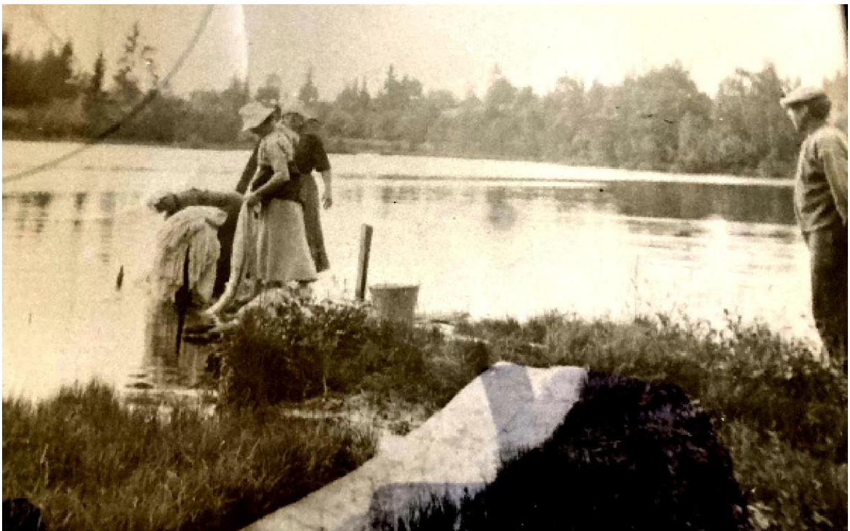
Klesvask ved Jorstadtjernet