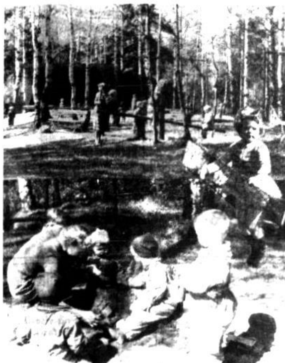
Samhold 26. mai 1954