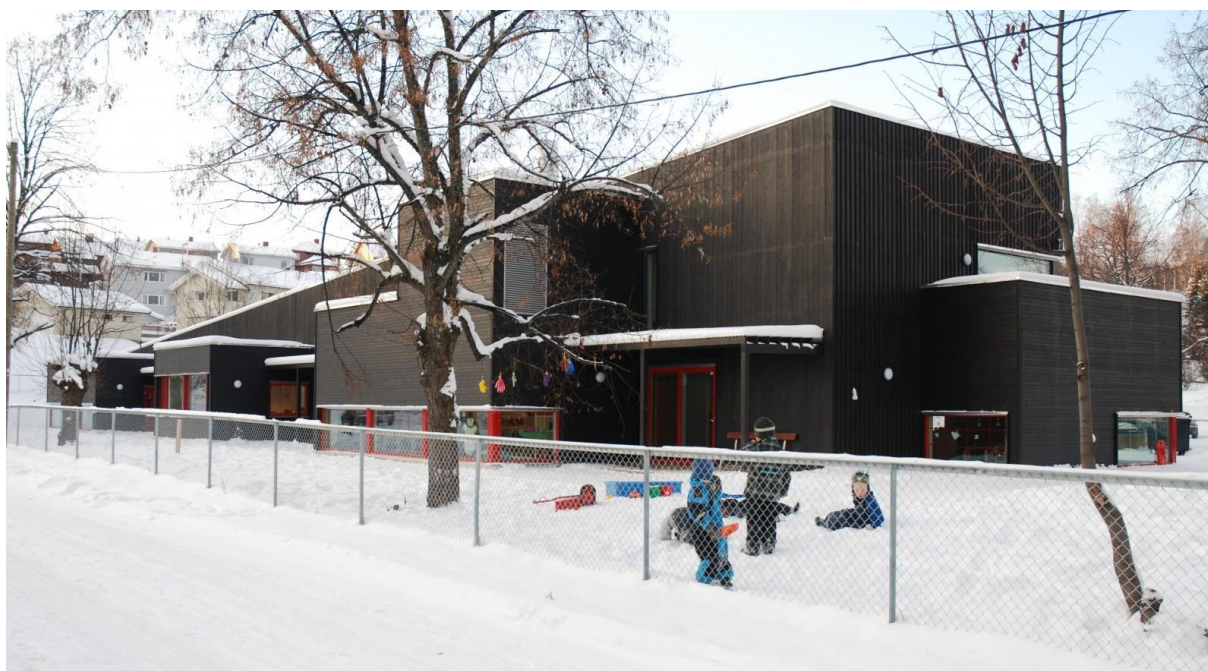
Tongjordet barnehage fikk i 2008 et flunkende nytt bygg.