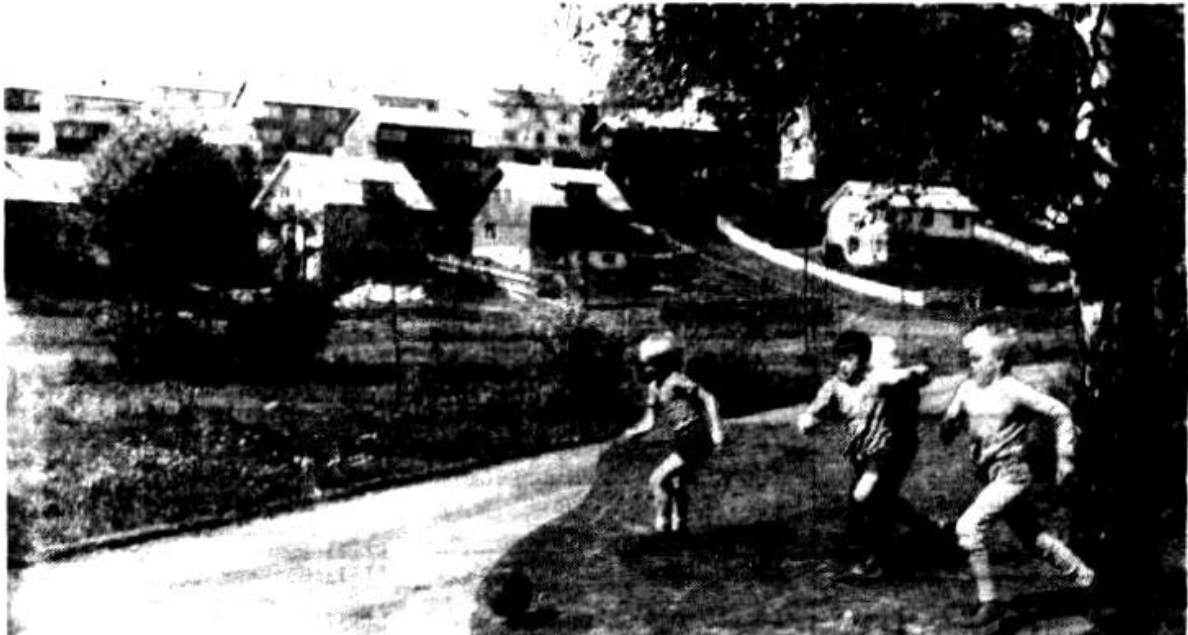
Samhold 26. mai 1954