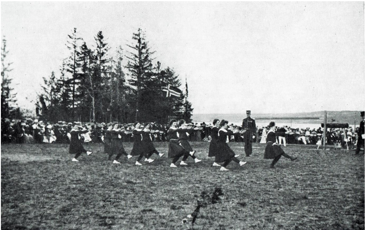
Dameturnere under stram kommando.