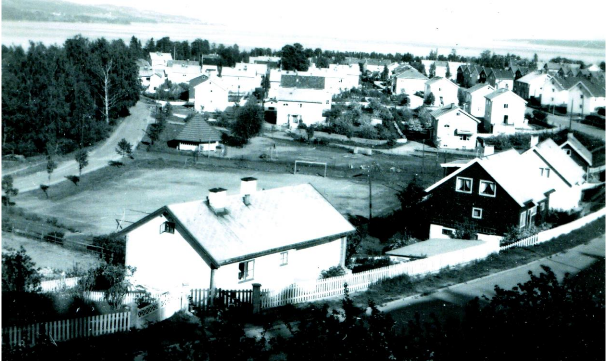
Tongabanen med barnehagen i bakgrunnen.