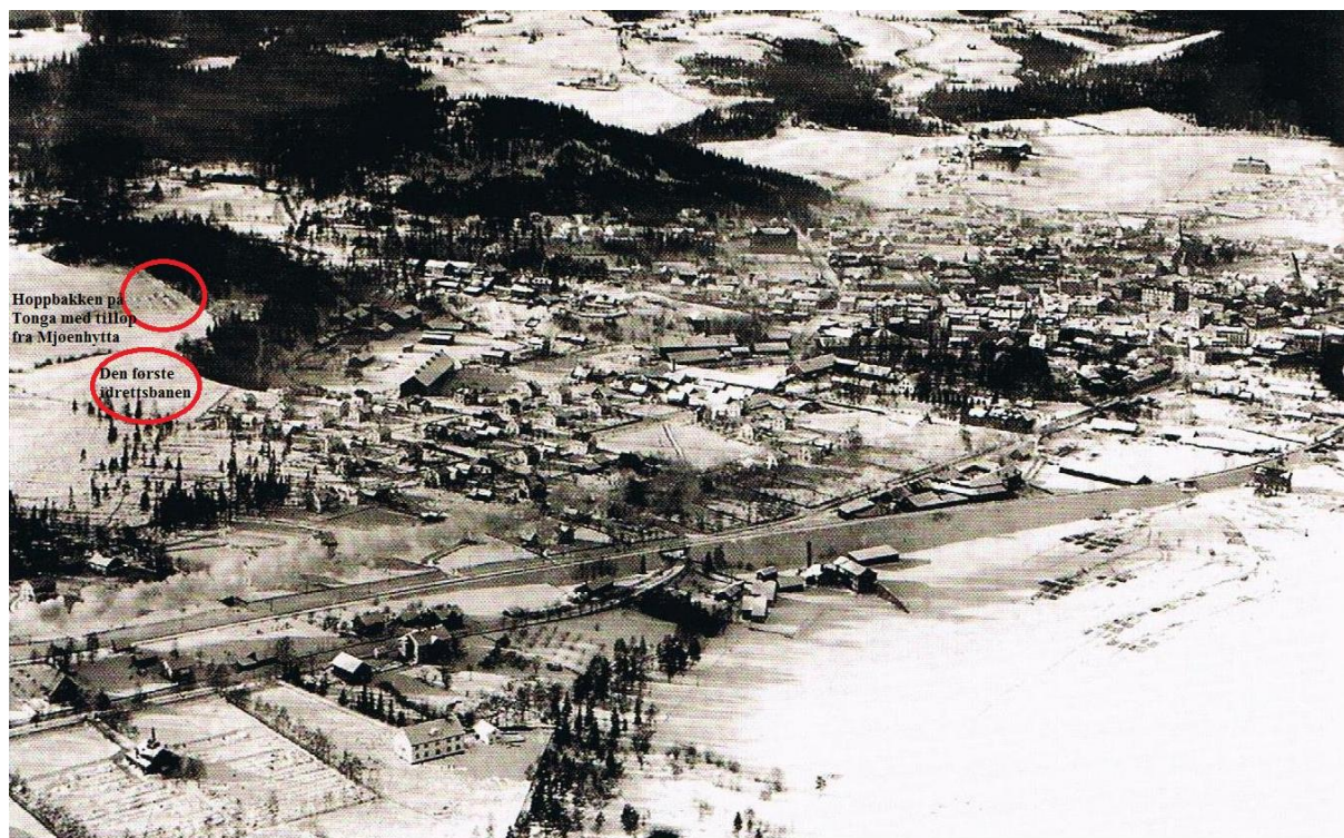
Vinterbilde av Gjøvik 1928.