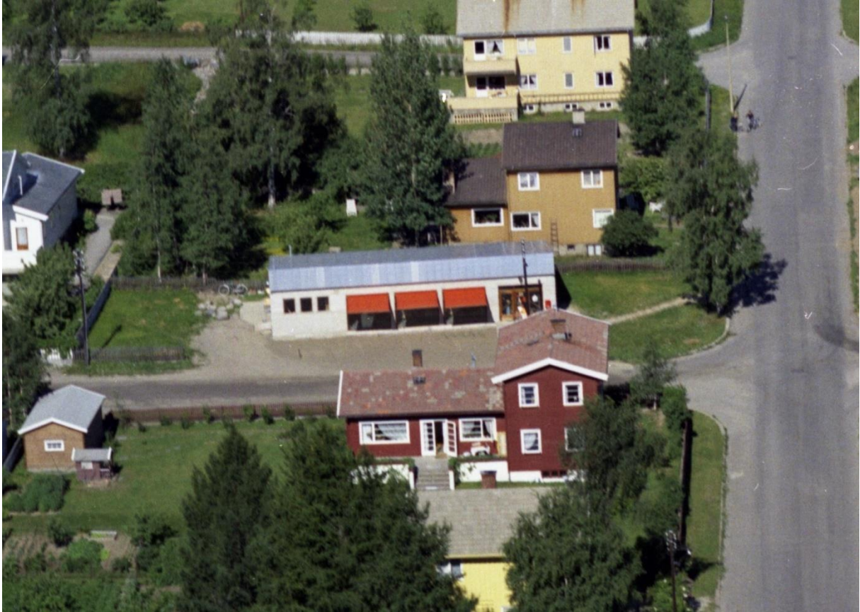
Bildet fra Widerøe 1961 viser butikken i Fauchaldsgate 20.