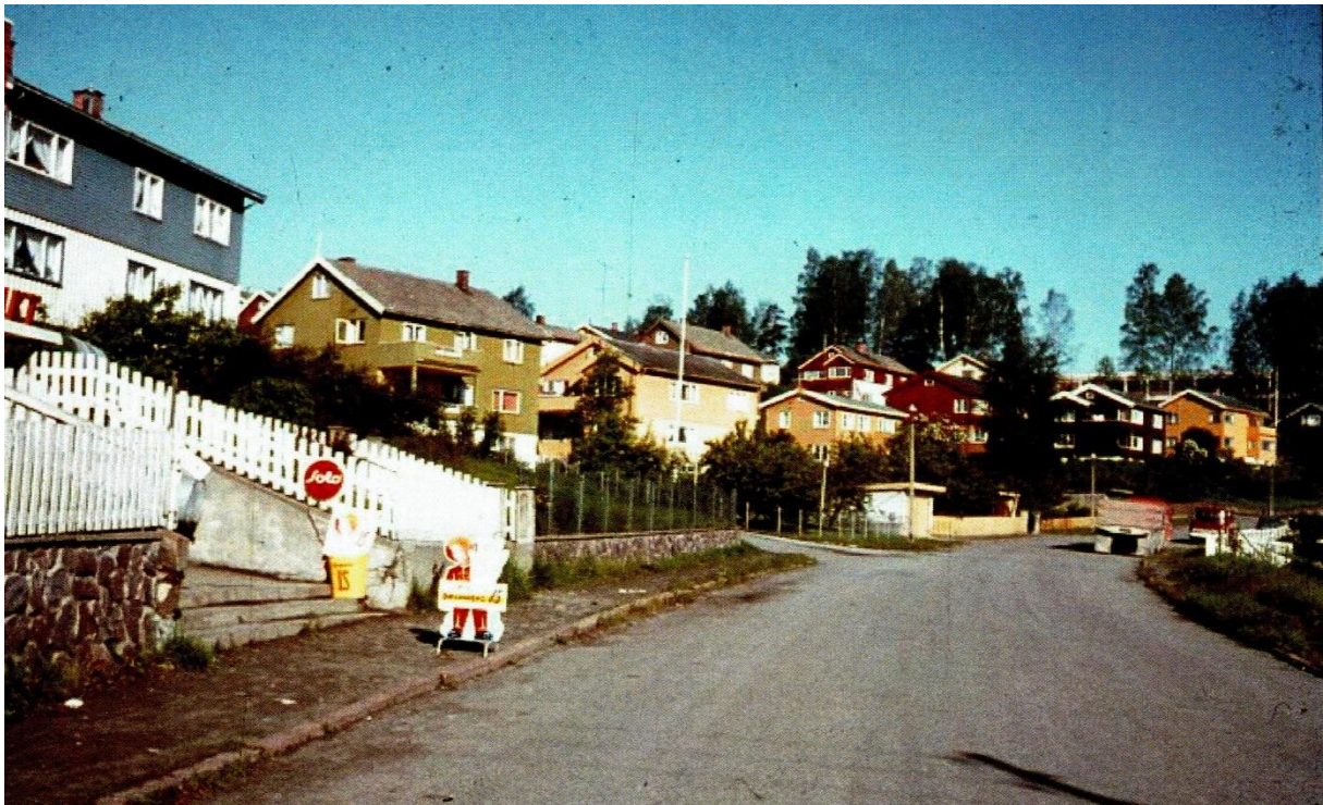
Vegen til «Diesen» var kort for mange med lommepenger.