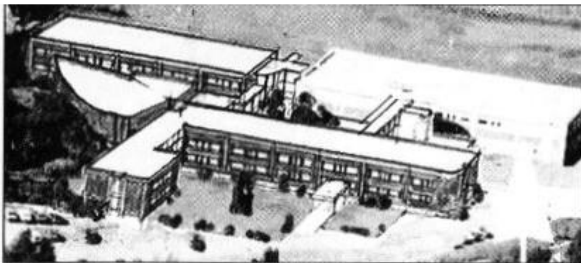
Slik blir den nye sykepleierhøgskolen på Kallerud. I høst starter byggingen av bygget som ligger parallelt med Kallerudbygg 4. (Tegning: Roar Jacobsen arkitektkontor a/s.)

Endelig konsept for Sykepleierhøgskolen. Oppland Arbeiderblad 1. oktober 1992