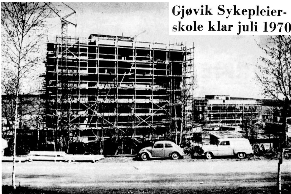
Gjøvik Sykepleier- skole klar juli 1970

Nasjonalforeningen for folkehelsen etablerte allerede i 1928 sykepleierskole i Oslo. I 1929 startet organisasjonen en forskole for sykepleiere, der 36 elever hvert år fikk fire måneders undervisning. Senere bidro organisasjonen til bygging av flere sykepleierskoler.