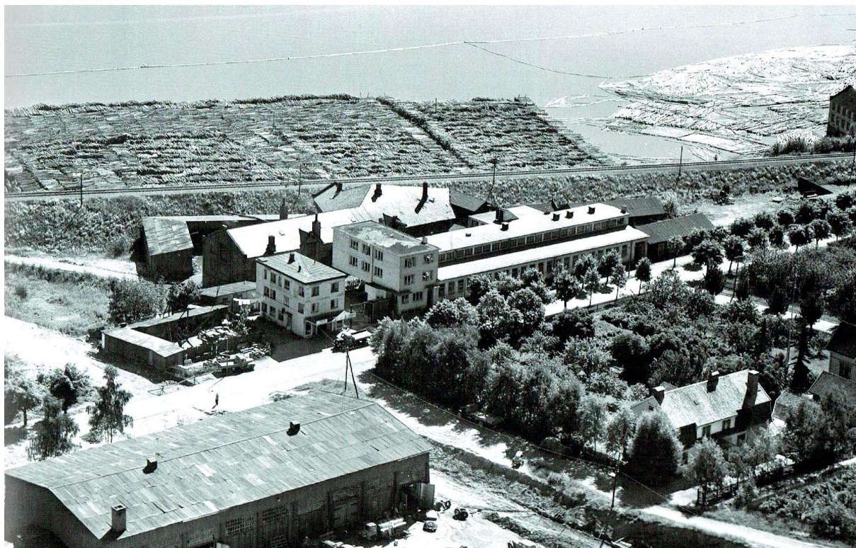
Ridehallen i 1952. Jernbanesporet er under opparbeidelse.