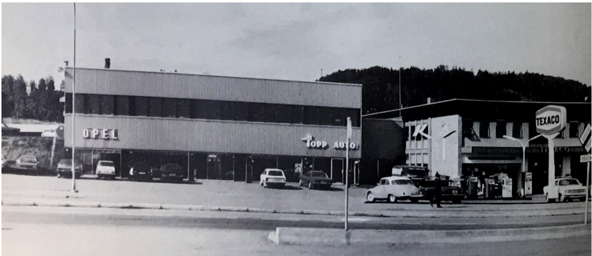
Utvidelse i 1968.