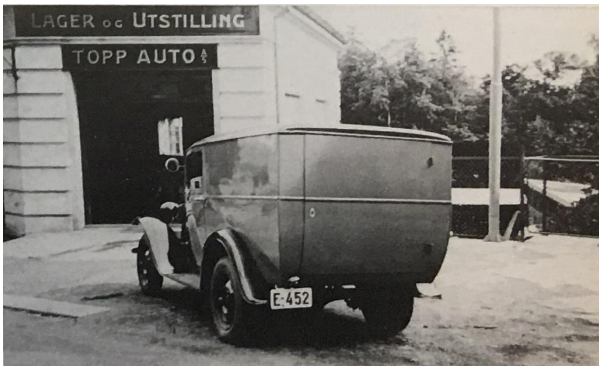
Topp Auto holdt fra 1937 til i Glassverksgata.

Da Topp Auto etablerte seg i 1952, leide de ridehallen av Gjøvik kommune. Denne sto på støperiets, dvs. Mustads, grunn, men hadde etter krigen blitt overtatt av kommunen. Etter lange forhandlinger med Mustad kunne Topp kjøpe tomt på 3,5 da i 1960. I 1964 var kravene til lokaliteter økt, og det såkalte «Adminbygget» ble bygget på nordsiden av hallen. I 1967 måtte så selve hallen vike. Den ble da revet til fordel for et stort tilbygg som ga Topp Auto et komplett og moderne bilanlegg. I 1979 kom ytterligere ett tilbygg mot sør. Dette inneholdt kaldt lager, delelager og bruktbilhall.