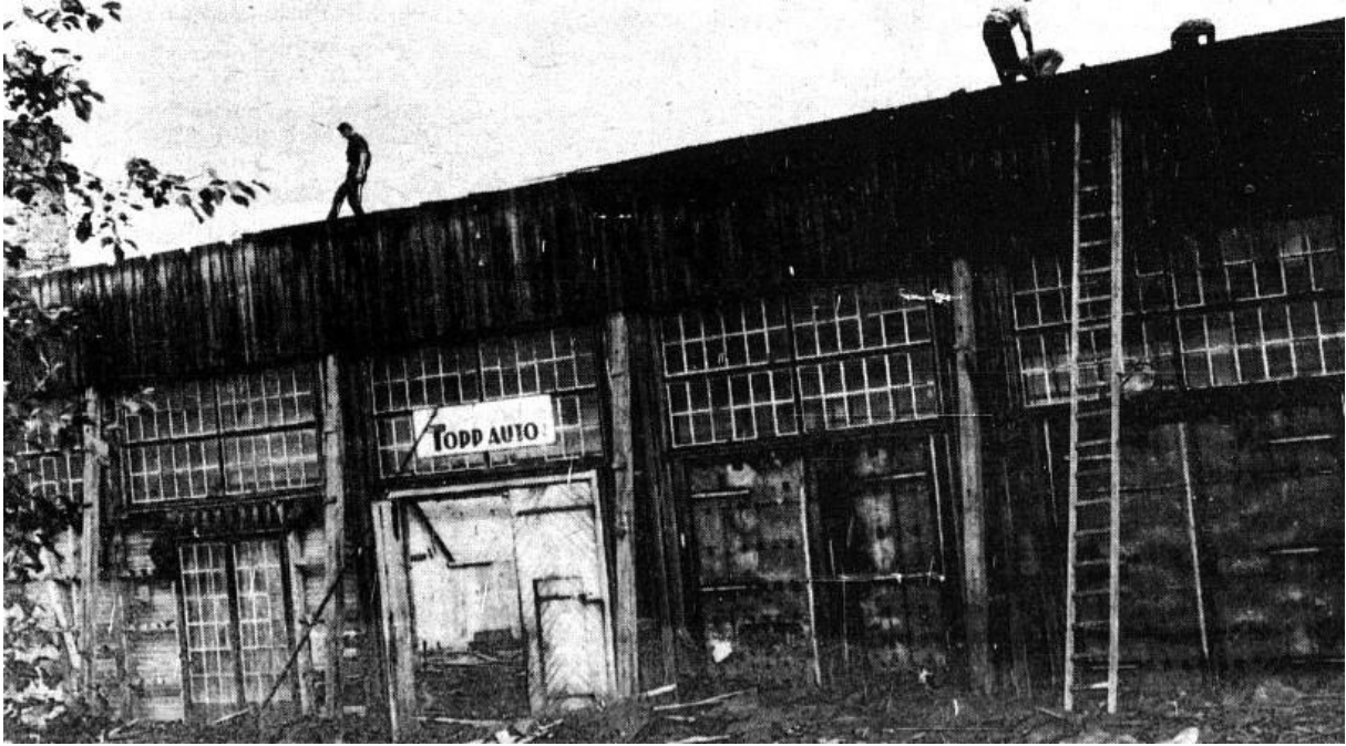
Ridehallen under riving 22. juli 1967.