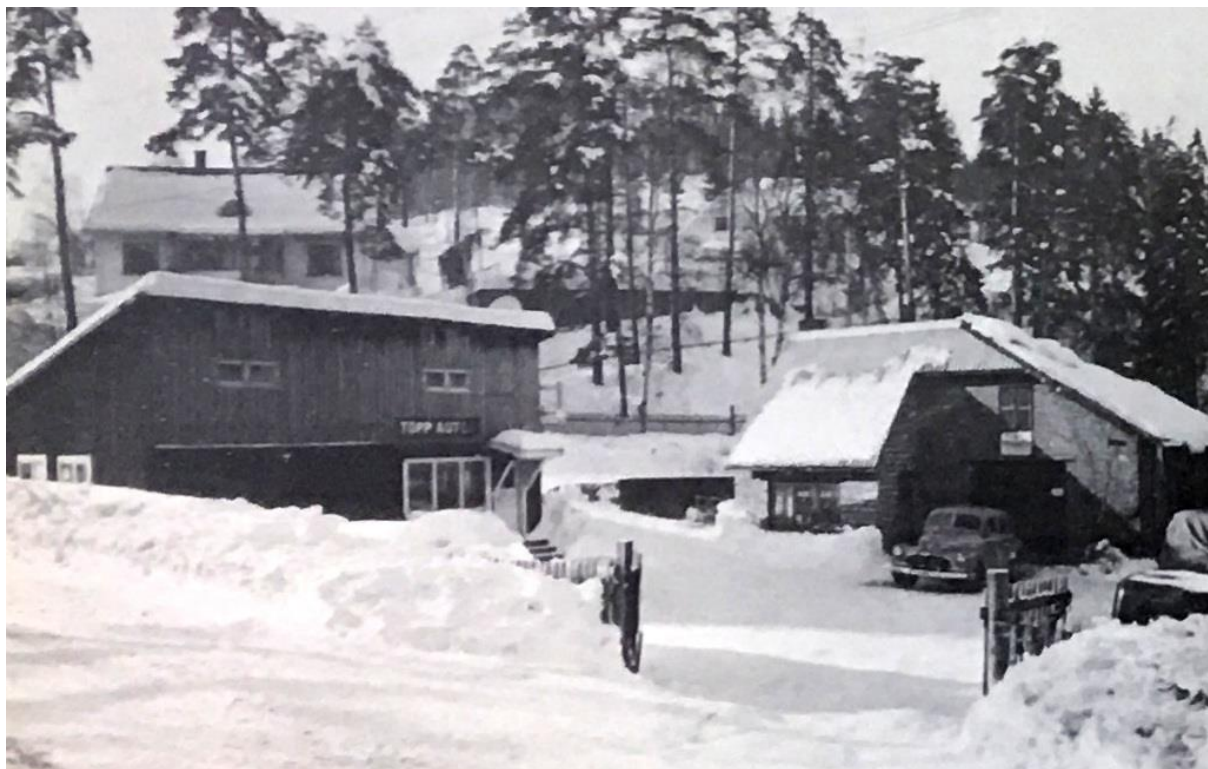
Storgata 49 på vinterstid.