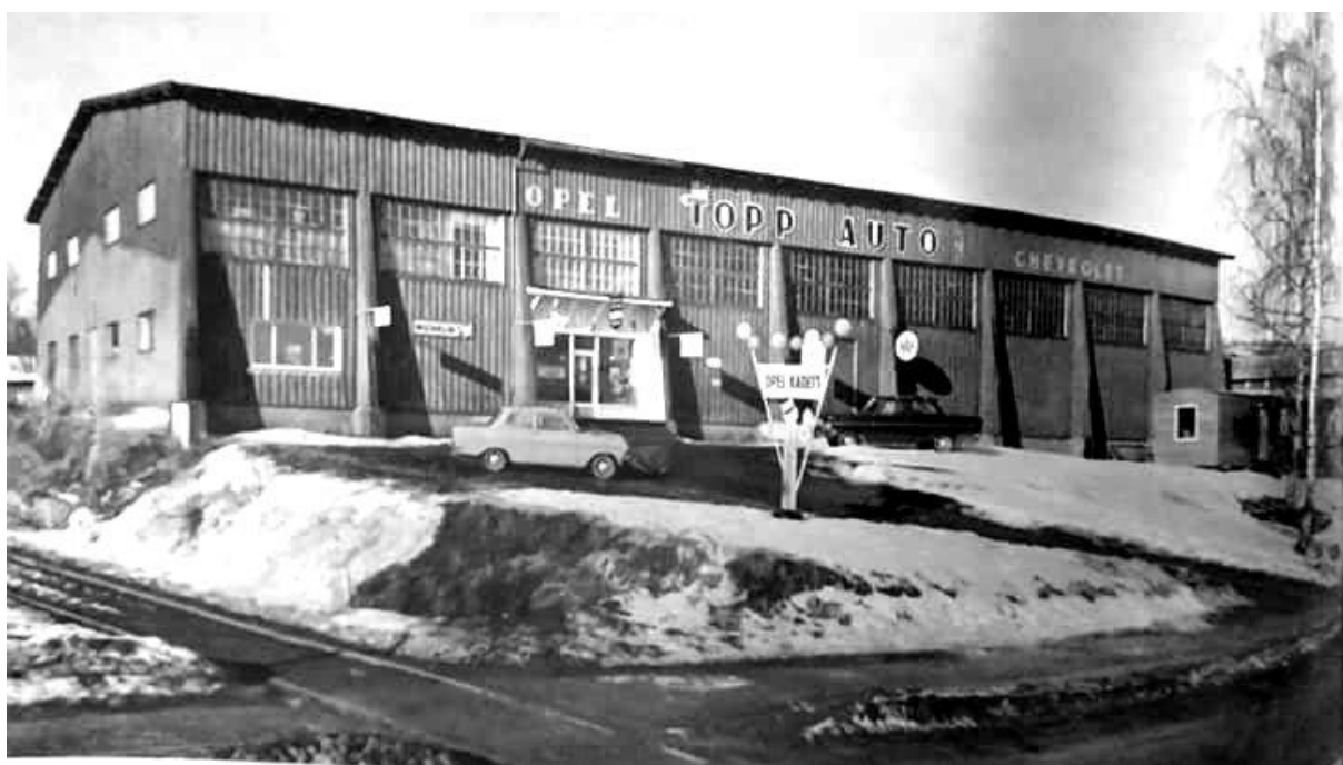
Ridehallen hvor Topp Auto holdt til fra 1952.