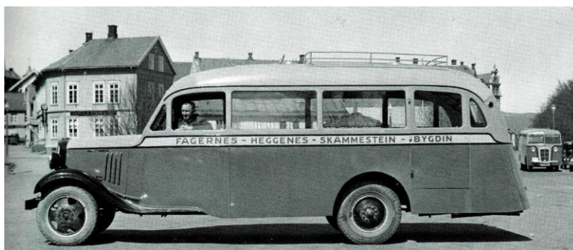
Denne bussen fra fabrikken i ridehallen skulle åpenbart gå i Valdres.