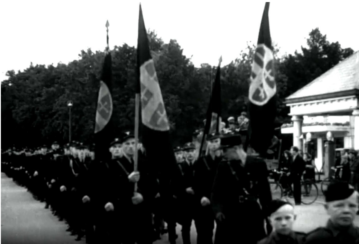
Bilder fra NRK Filmavisen 7. september 1942 (se flere bilder til slutt i artikkelen).