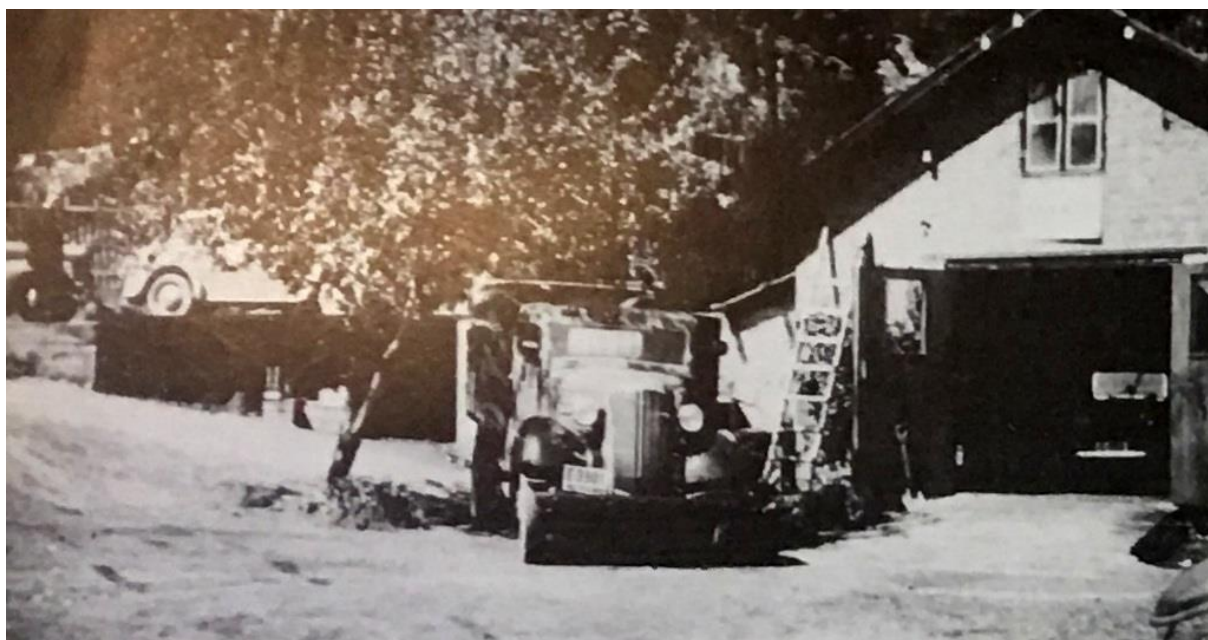
Brødrene Topp leide fra 1940 plass hos faren, Bernt Topp, i Storgata 49.