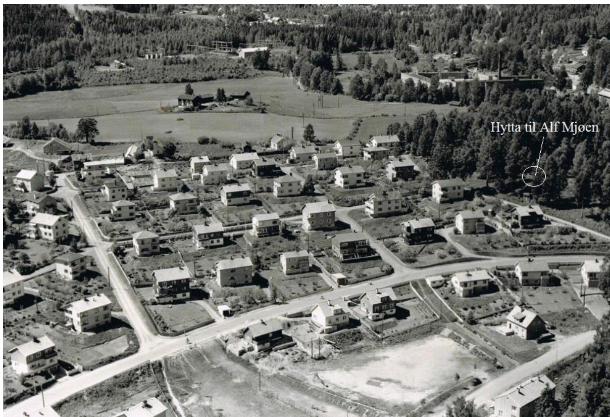
Flyfoto 1957 av øvre del av Tongjordet.