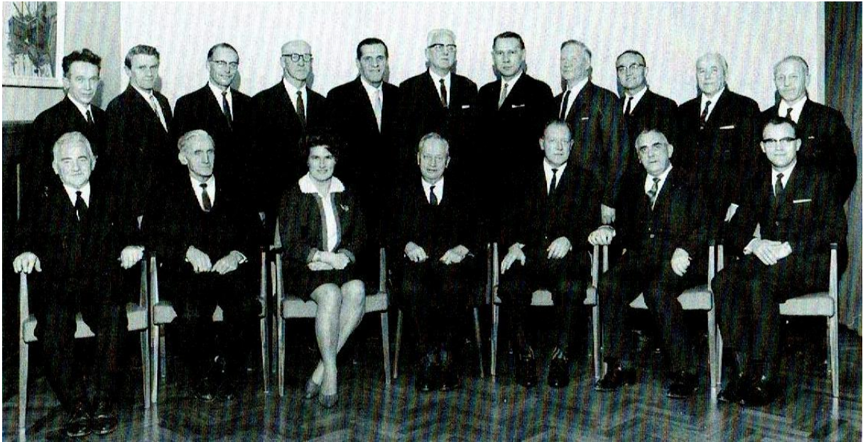
Gjøviks første formannskap etter sammenslutningen i 1964.

representanter kanskje ikke så for seg i sin iver etter sammenslåing var at politikere fra bygdene i noen tilfelle skulle få avgjørende innflytelse på byen. Dette gjelder spesielt representanter fra Snertingdal og Biri, som gang på gang har irritert folk i Gjøvik med sin påvirkning i urbane spørsmål. I saken om Rv4 kom det også anklager om at politikere fra bygdene på en utidig måte blandet seg inn i byens affærer.