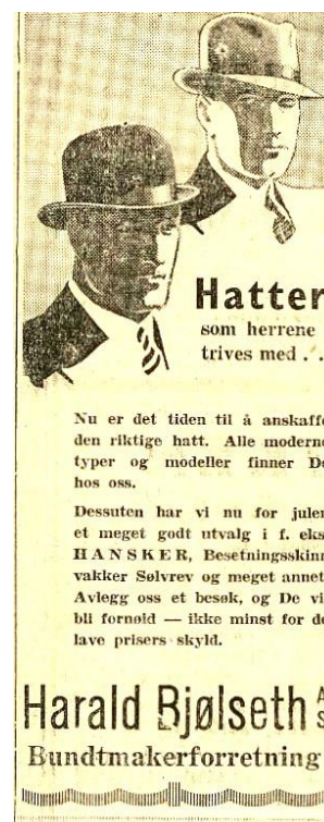
Annonse 15. desember 1936