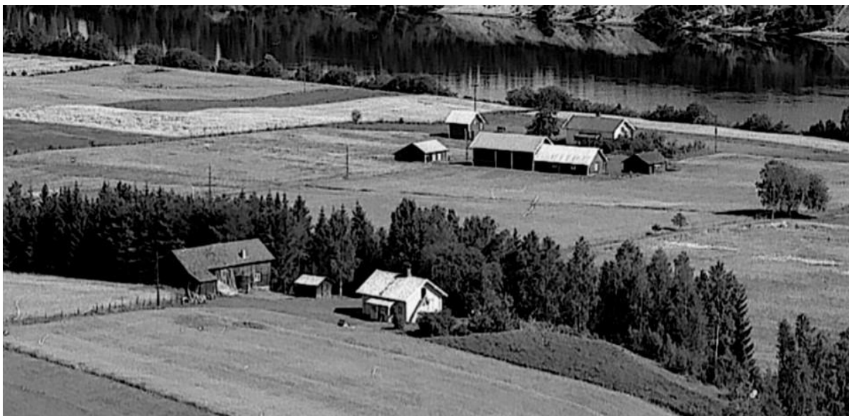
Bjølsetbakken i Elverum bakerst mot Glomma.