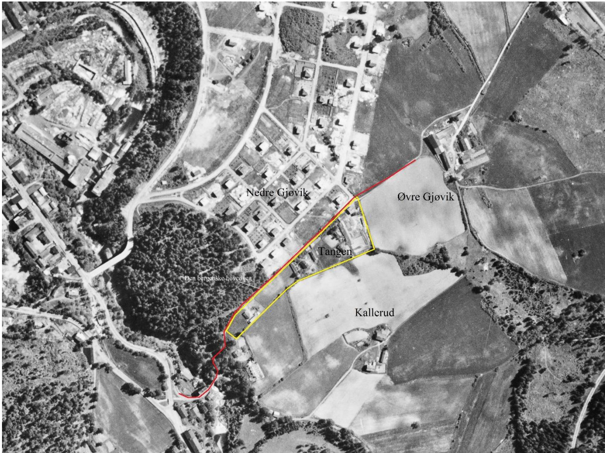
Gjøviktangen på flyfoto fra 1948. Den bergenske hovedveg er markert med rødt.

Husmannsbruket lå inneklemt mellom denne gamle vegen og garden Kallrud. Arealet besto av et avlangt jordstykke med en liten haug hvor våningshuset lå, mens resten var ganske flatt. En del av dette var myraktig, og det var nok grunnen til at arealet ikke hadde særlig verdi som dyrkningsjord. Vegen gjennom området, også kalt «Den bergenske hovedvei», måtte rimeligvis ligge på fast grunn. Dette jordstykket eller «tangen» ble liggende igjen og var passende som bruk for en husmann. I og med at husmannsplassen tilhørte Nedre Gjøvik, er det rimelig at den fikk navnet "Gjøviktangen". På lokal dialekt er det så ikke vanskelig å forestille seg at man omformet "Tangen" til "Tonga". Alle