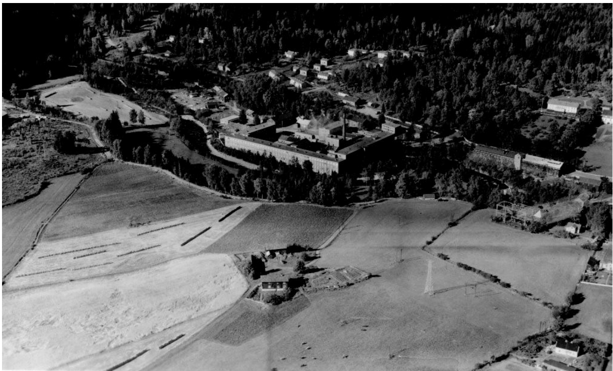
Kallerud midt i bildet med Mustads fabrikker i bakgrunnen. Kallerudbakken midt på, i høyre bildekant.