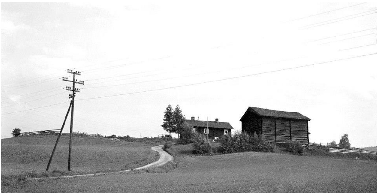
Kallerud 1950.