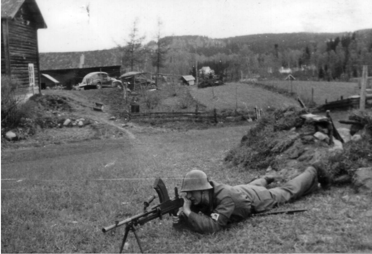
Våren 1945 var Kallerud et av oppmarsjområdene for hjemmestyrkene.

74 da, utskilt med gnr./bnr. 67/27. Det som hadde vært gode jorder og beiter langs Hunnselva, ble på forskjellige måter tatt til andre formål. Bygging av Rv4 forandret området totalt. Lengst i vest hadde Mustad fra 1906 hatt reguleringsdam for vanntilførsel til sitt kraftverk. Dette området, Kallerud vest, sammen med øvrig areal mellom jernbanen og Hunnselva, skulle i nyere tid bli svært verdifulle tomter for handelsforetak. Etter hvert skulle det på Kallerud øst komme store skoleanlegg, studenthybler og idrettsanlegg som har gjort sitt til å få oss til å glemme den gamle garden. Men navnet, og den gamle hovedbygningen som er datert til ca. 1750, vil i overskuelig framtid være minner om det som var.