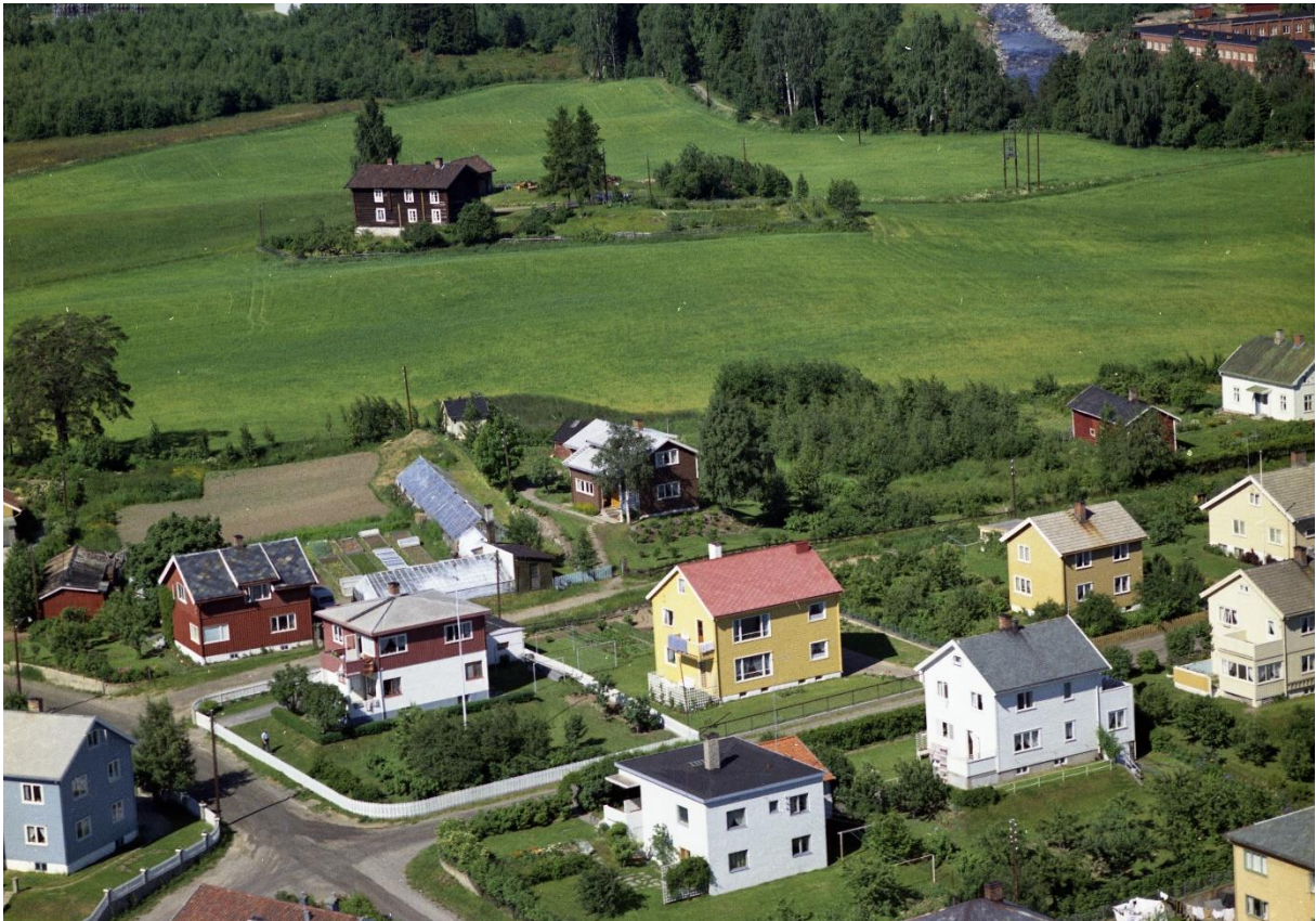
Kallerud i 1961 med litt av bebyggelsen på øvre del av Tongjordet.

I 1967 ble større deler av Kallerud fradelt for å selges til andre formål. En stripe langs grensen mot Øvre Gjøvik ble oppdelt til boligtomter for det som skulle bli Edv. Griegsgate 5, 7, 9, 11, 13, 15 og 17. Tomtene ble solgt til ansatte i O. Mustad & Søn AS. For framtidig skoleformål ble det gjenværende av den dyrka marka,