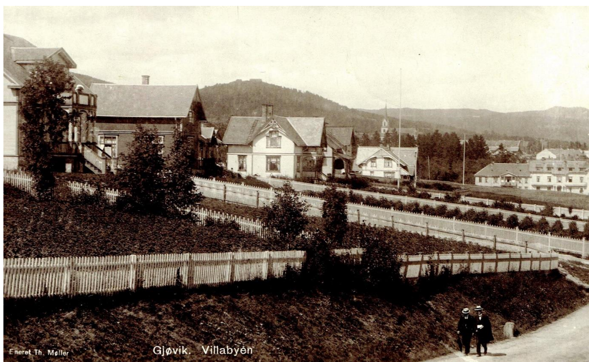
Villabyen med Sandsgården i bakgrunnen.

Denne tok hele Sverres gate med sju boliger og gangforbindelsen til byen var en saga blott. Fotgjengerne ble henvist til Strandgata. I 2001 ble så det store byreparasjonsprosjektet Mustadhagen påbegynt. Dette inkluderte en tunnel for trafikken på Rv4, og gangforbindelsen ble gjenopprettet.