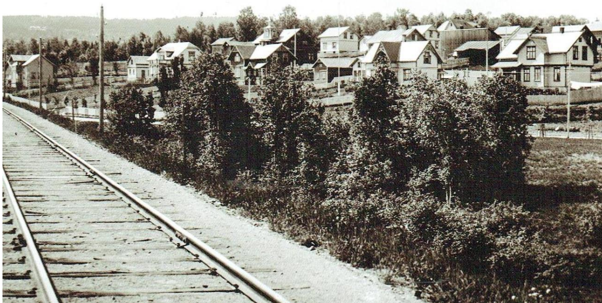
Villabyen var kjent for sine elegante hus og store hager.