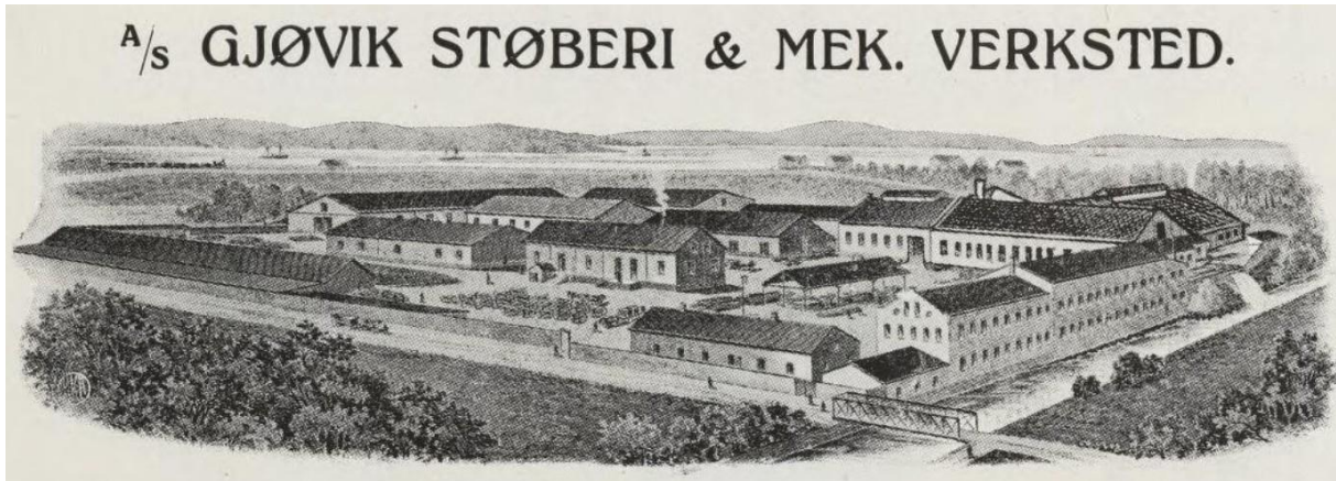
Perspektivtegnning fra 1914