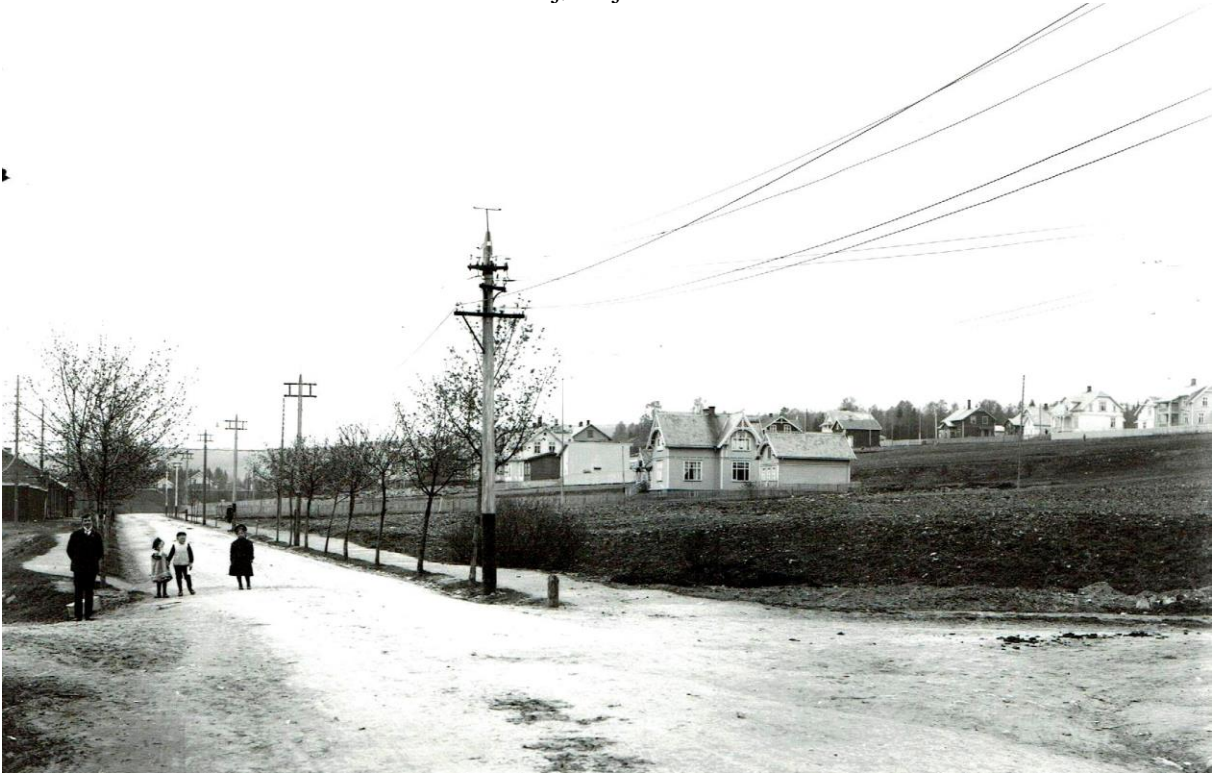
Villabyen 1912.

I 1904 kom starten på boligbygging på Gjøvikjordet ved at byggmester Jens A. Ugland fikk i oppdrag å sette opp 12 boliger. Disse ble holdt i ensartet stil og utgjorde et sjarmerende bilde av gammel byggeskikk. Seinere kom nye hus til, og mange ble bygd i samme arkitektur. Fram til 1960-tallet ble husene og tomtene beholdt som de opprinnelig var. Området fikk tidlig det betegnende navnet «Villabyen» som anerkjennelse av strøkets karakter og kvaliteter.