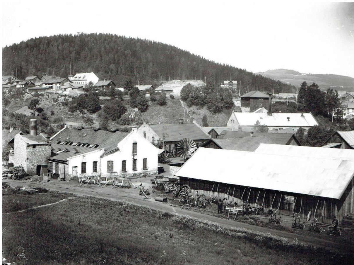
Gjøvik Støperi ble startet i 1890. De produserte varer i støpejern og var store leverandører av redskap til landbruket.

kom til nytte da Gjøvik Støperi startet opp. I 1917 ble bedriften solgt til Felleskjøpet, som drev fram til 1940. Da overtok O. Mustad & Søn AS så vel driftselskap som eiendom. Tomta var på hele 15,5 da og gikk helt ned til Strandgata.