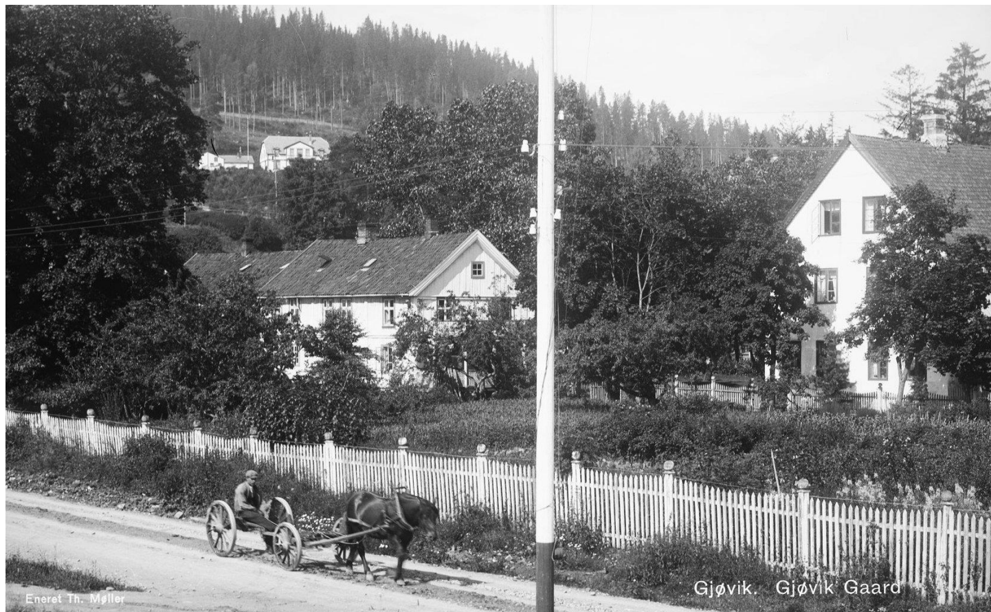
Hovedbygningen og drengestua på Nedre Gjøvik.

Med sin beliggenhet på sørsiden av Hunnselva hadde Nedre Gjøvik beskjedne jordbruksarealer. Disse besto av Gjøvikjordet, som lå nederst, med Tongjordet ovenfor. I tillegg hadde man Berghusskogen som kunne benyttes til beite. Da den opprinnelige garden Gjøvik ble delt på 1600-tallet, fikk Øvre Gjøvik betydelig større arealer. Hvis delingen skulle ende opp med to likeverdige parter, har man lagt vekt på betydningen av rettighetene som Nedre Gjøvik hadde ved å ligge ved Hunnselva. Gjøvikjordet lå inntil husene og parken på garden.