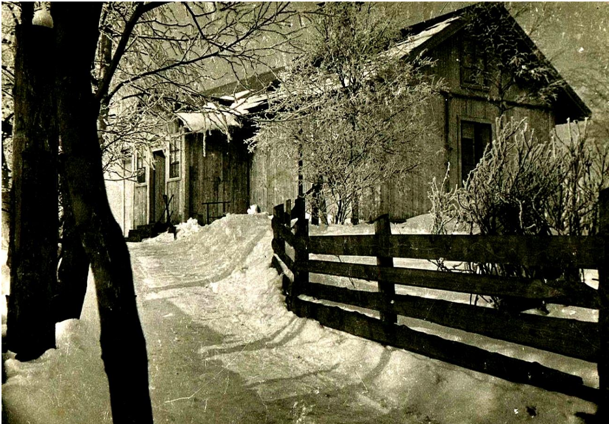
Våningshuset på Gamletangen. Huset står der fortsatt.