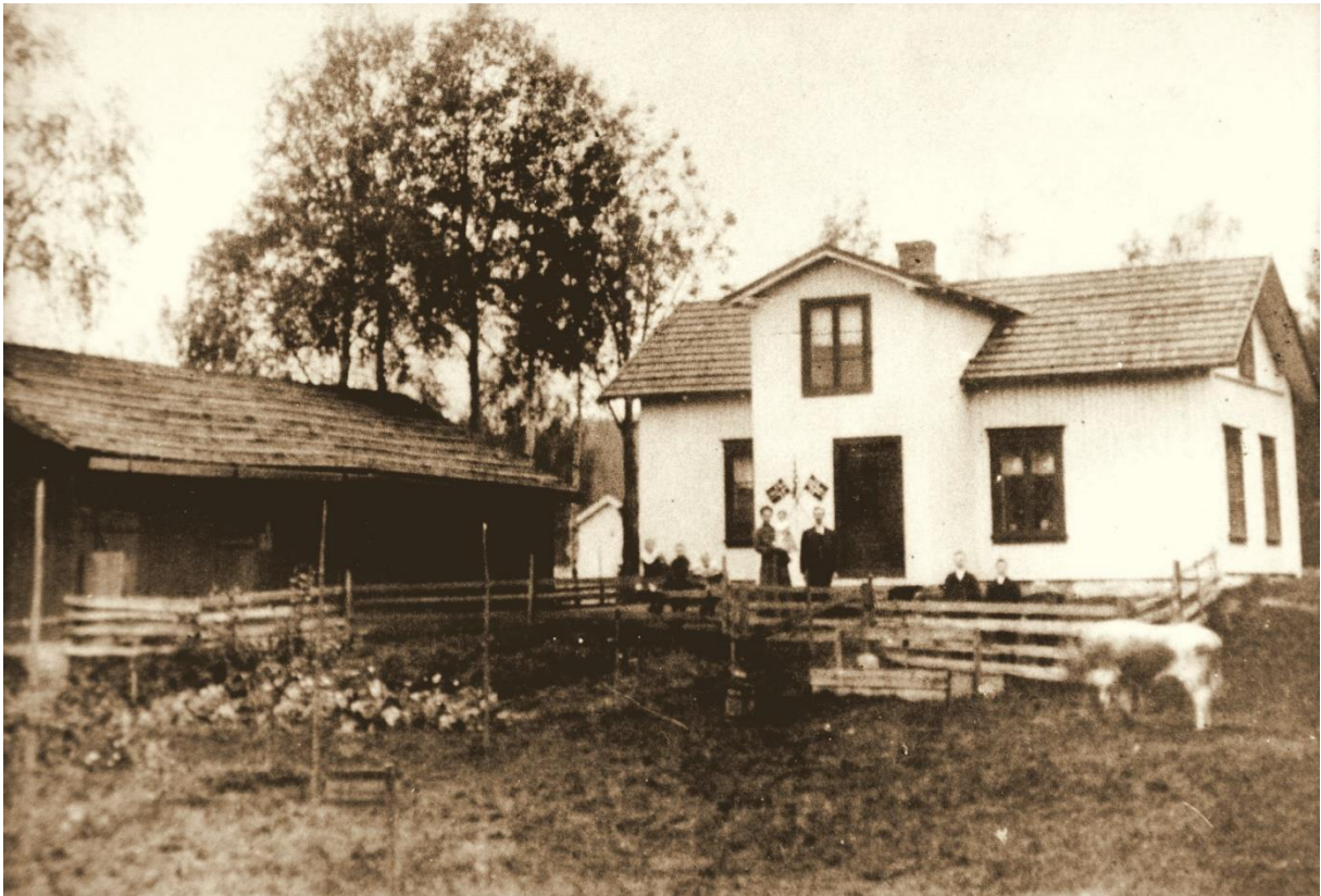
Haugen 17. mai 1907.