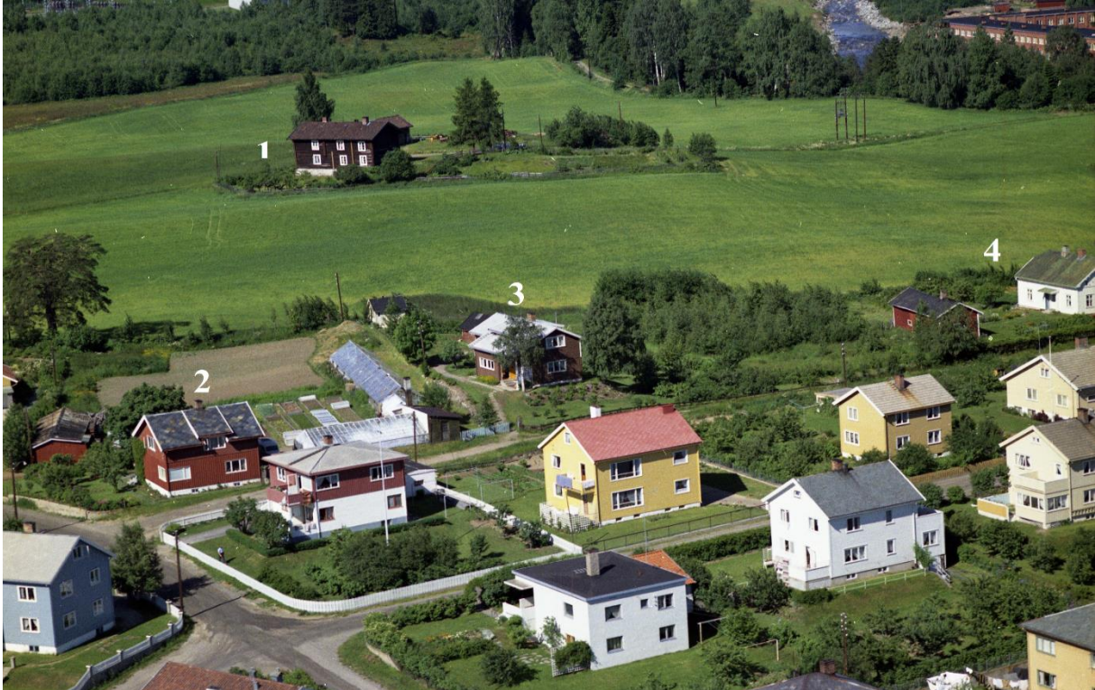
1. Kallerud (står fortsatt), 2. Tangen søndre (står fortsatt), 3. Gamletangen (står fortsatt), Solerud (revet, bygget nytt i 1978)