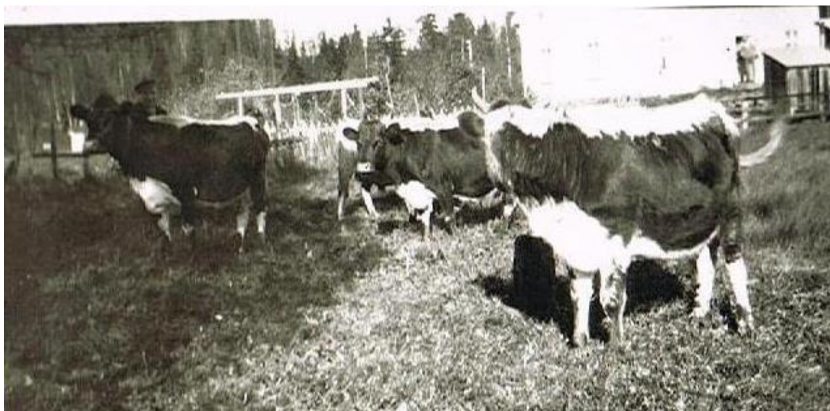
Kua på Gamletangen. Solerud ses bak til høyre og Haugen skimtes i bakgrunnen til venstre.