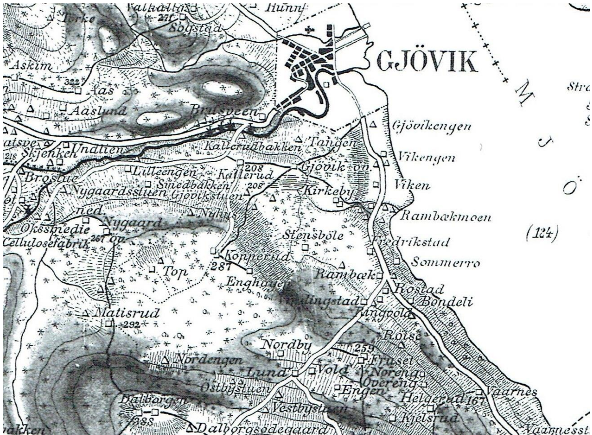
Kartet fra 1879 viser Rambekkmøens strategiske plassering på vegen mellom Gjøvik og Toten.