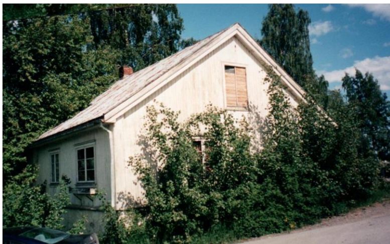
Rambekkstua i 1998

bodde han og drev garveriet til han kjøpte Rambekkmoen i 1822. Sannsynligvis har han fortsatt å drive garveriet her. Han giftet seg i 1823 og fikk to barn før han flyttet til Nedre Gjøvik mellom 1826 og 1828. I denne perioden kan han og familien ha bodd i den såkalte «Rambekkstua».