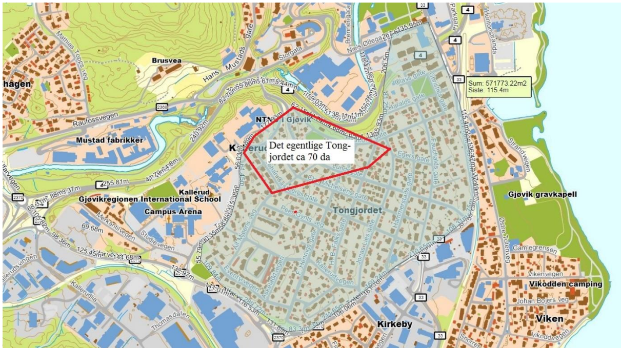
Kart 2018 med det opprinnelige Tongjordet