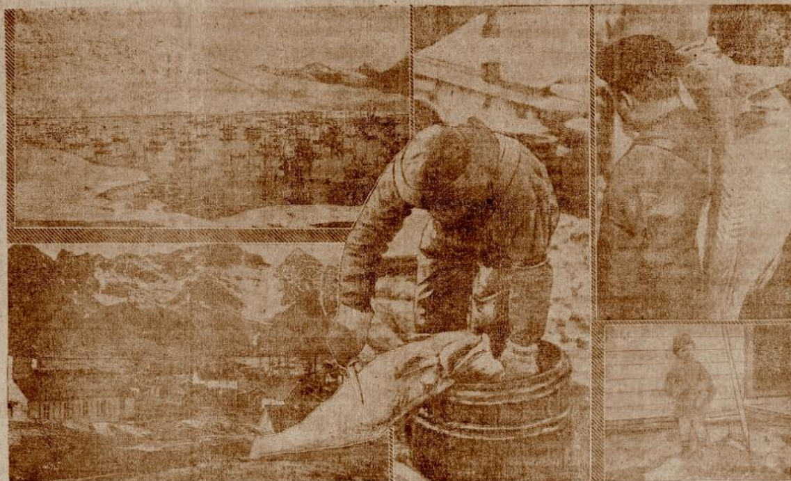
Øverst tilvenstre: Fiskerskibe i en av Lofotens Fjorde.