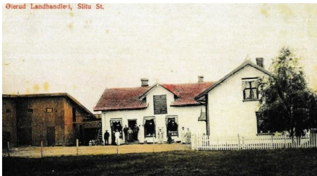
Landhandleriet Øiestad på Slitu

Familien la i 1914 ut sørover på en lang ferd som skulle ende i Askim i Østfold.