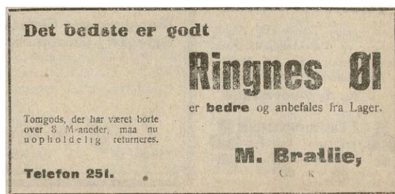
Brennevinsforbudet hindret ikke ølannonser.