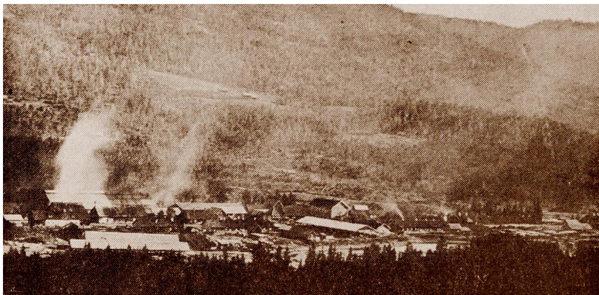
Hurdal Glassverk ble nedlagt i 1895.