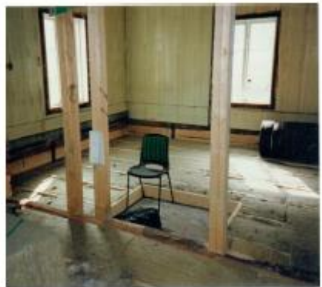
Skybergstua var i dårlig forfatning da den ankom Gjøvik Gård og utbedringsarbeidene var omfattende.