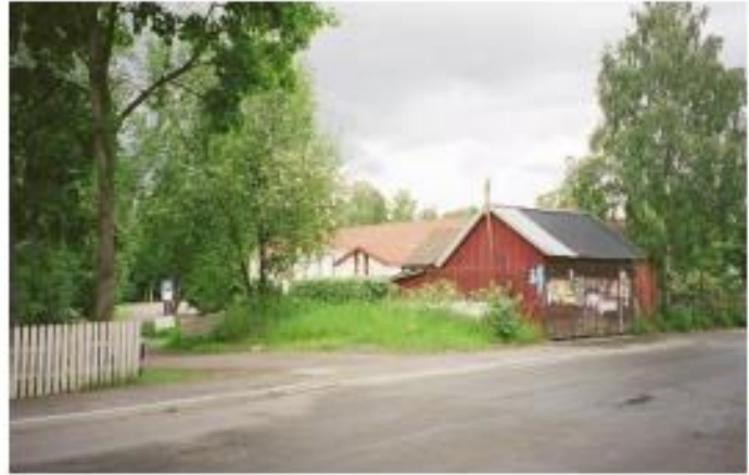
Mjøens gamle garasje ble borte og Skybergstua fikk en god parkeringsplass foran huset.