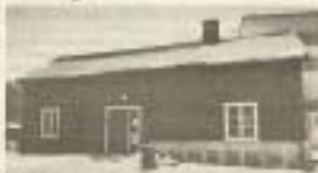
Skybergstua i Gjøvik blir ikke flyttet over den gamle. Etter at man hadde planlagt å flytte den til den nye vegtraseen for vestre del av byen, er det nå klart at dette ikke vil skje.

Det er ikke lenger aktuelt å flytte Skybergstua i Gjøvik til den nye vegtraseen for vestre del av byen, og det er nå klart at dette ikke vil skje.