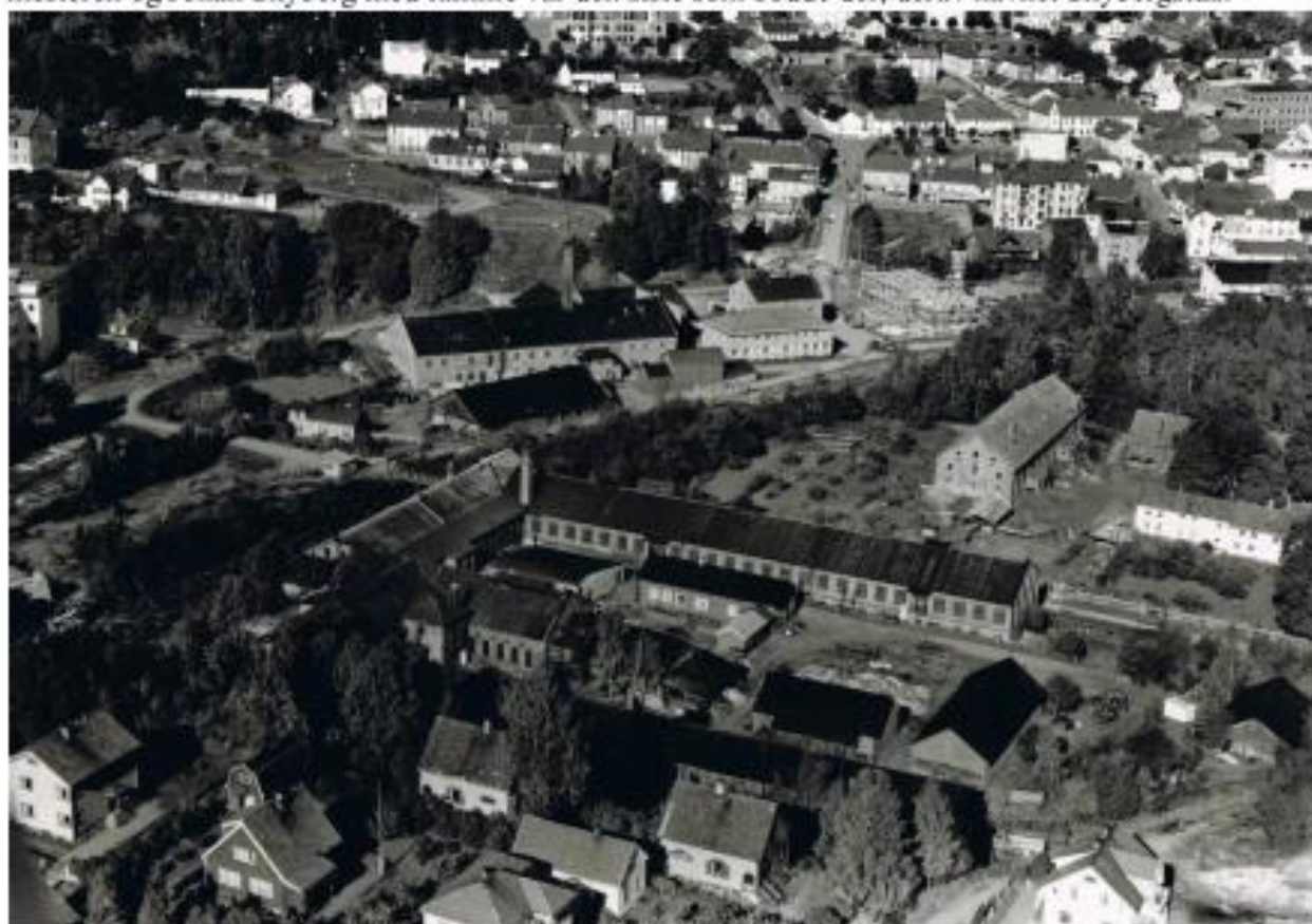
Skybergstua i 1952. Kornsiloen under bygging i bakgrunnen.