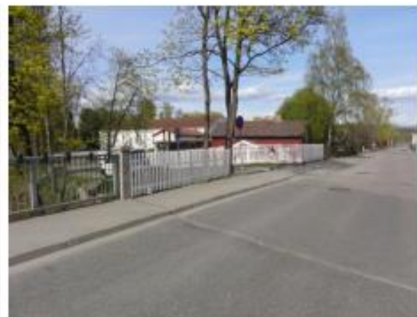
Gjerde rundt Skybergstua er satt opp på dugnad. Huset og gjerdet vedlikeholdes og males regelmessig, også på dugnadsbasis.