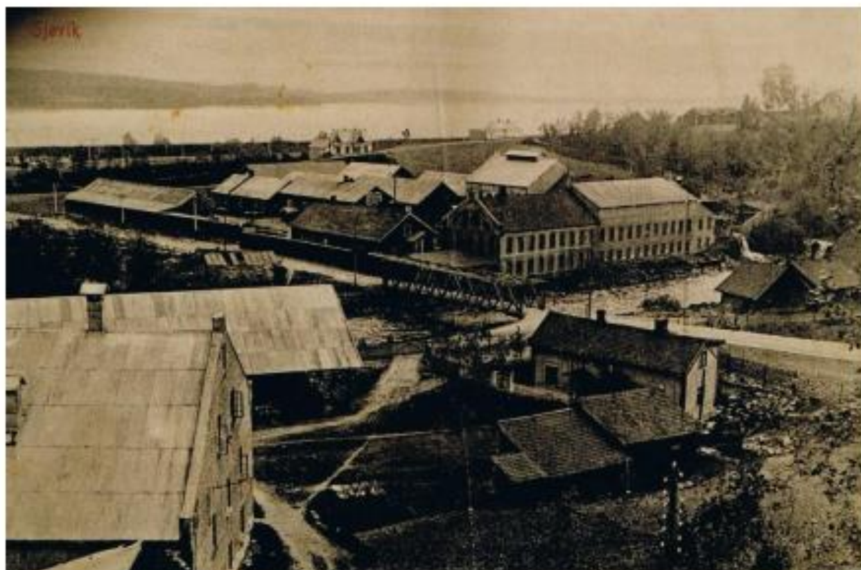
Skybergstua med Gjøvik Støperi i bakgrunnen ca 1900