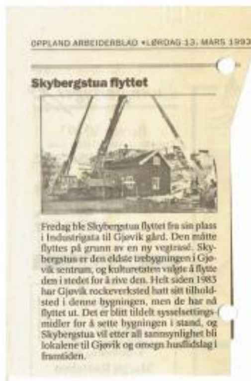
Fredag 12. mars 1993 ble Skyberstua flyttet til sin nye tomt på Gjøvik Gård.