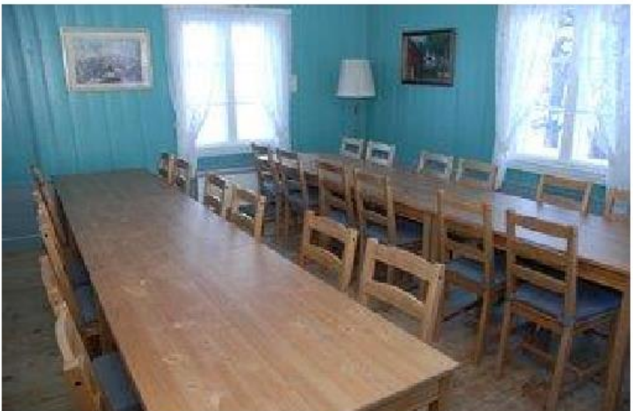
Skybergstua har gode fasiliteter for møter og selskaper med bordplass i stua for 24 personer. Kjøkkenet har kjøleskap, oppvaskemaskin og komfyr og det er rikelig med dekketøy.