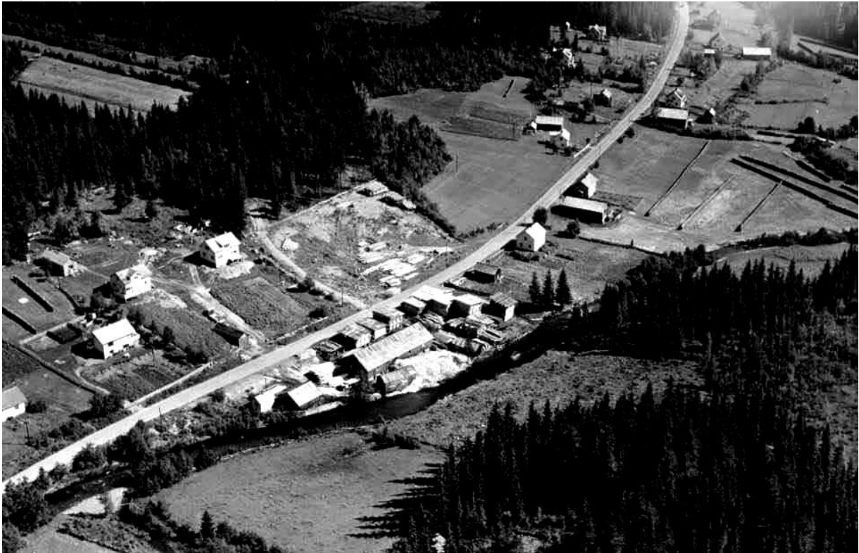
Bratengsaga i 1952. Samfunnshuset på andre siden av riksvegen er akkurat påbegynt.

Bratengsaga var en viktig institusjon i Vardal i en tid da bruken av gardssager gikk tilbake. Den hadde stor lokal betydning som arbeidsplass, avtaker av tømmer og leverandør av trelast og flis.