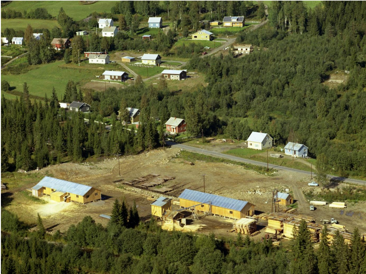
Bratengsaga i 1966.

plasserte den ved skiløypa på Blivgodt. Der har den betjent sultne og tørste skiløpere i mange år.