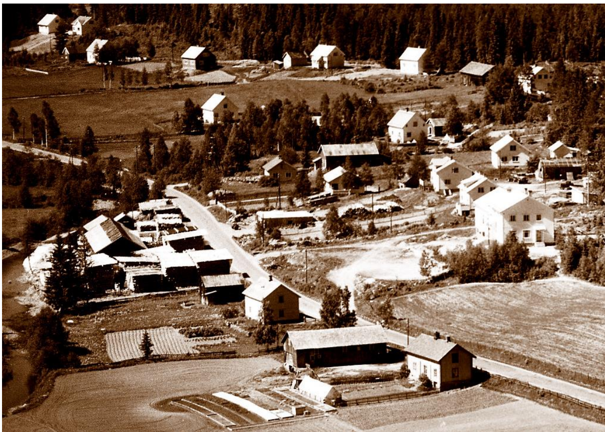
Bratengsaga til venstre med det nybygde smafunnhuset til høyre.

Strøm til så krevende virksomhet som et sagbruk kan ikke ha vært tilgjengelig før godt etter 1930.