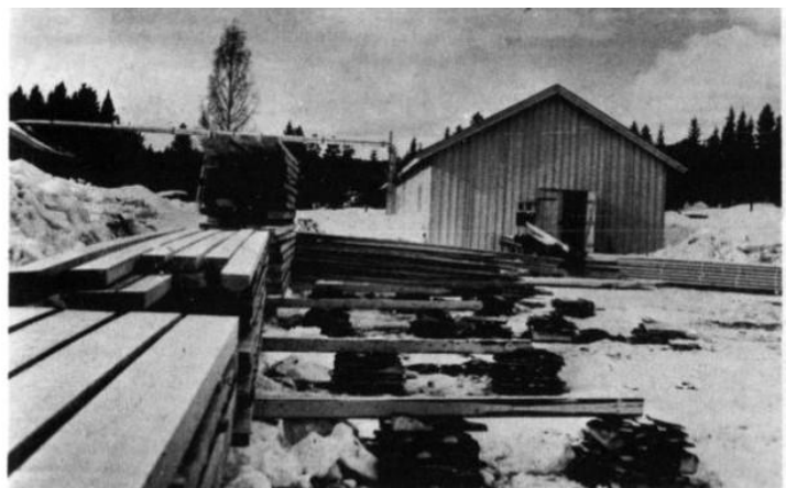
De første plankestablene tar til å gro opp utafor den nye saga.

Kravene til sosiale rom på den tid var ytterst beskjedne. Som hvilerom for de sju ansatte ble det bygget en brakke på ca 10 m 2 . Denne fungerte også som bedriftens kontor. Først i 1980 kom det bedre løsninger for de ansatte. Da kom det spiserom, WC og dusj i eget bygg. Dette ble bygget med en underetasje som rommet en garasje. Den gamle hvilebrakka ble gitt bort til Haug Idrettslag som