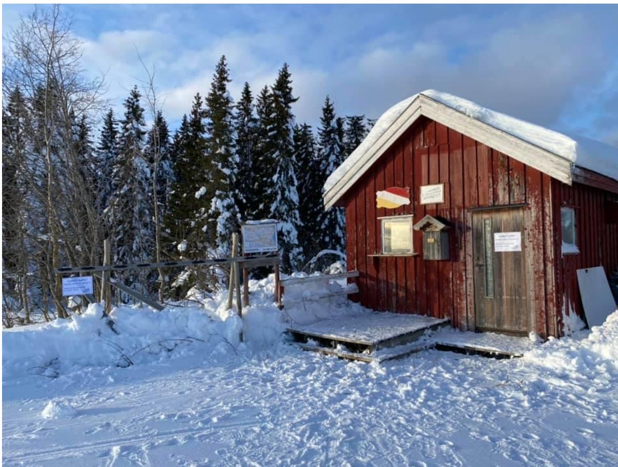
Hvilebua fra Bratengsaga frister nå (2021) tilværelsen som kiosk på Blivgodt. Den er litt sliten, men fungerer utmerket for små og store skiløpere som trenger noe å styrke seg på.