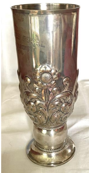
Damenes pokal fra Holmenkollen 1914

Den eventuelle vinder er forpligtet til at indlevere pokalen til bestyrelsen for Gjøvik idrætsforening mindst 14 – fjorten – dager forud for det næste aars skirend, hvorom vedkommende i god tid vil bli underrettet.