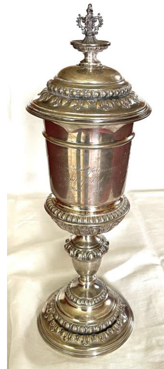
Vandrepokalen fra 1914