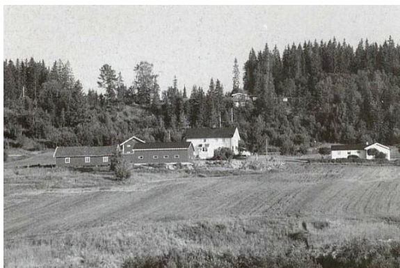
Blekkerud i Norske Gardsbruk 1998