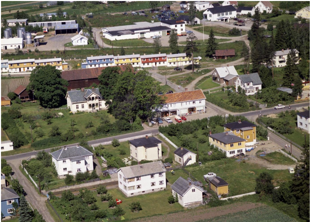
Viken med nabobygninger 1961.

Viken ble stadig mer nedbygget og da Bjarne Nygaard døde i 1967 solgte arvingene det gjenværende til Gjøvik kommune.