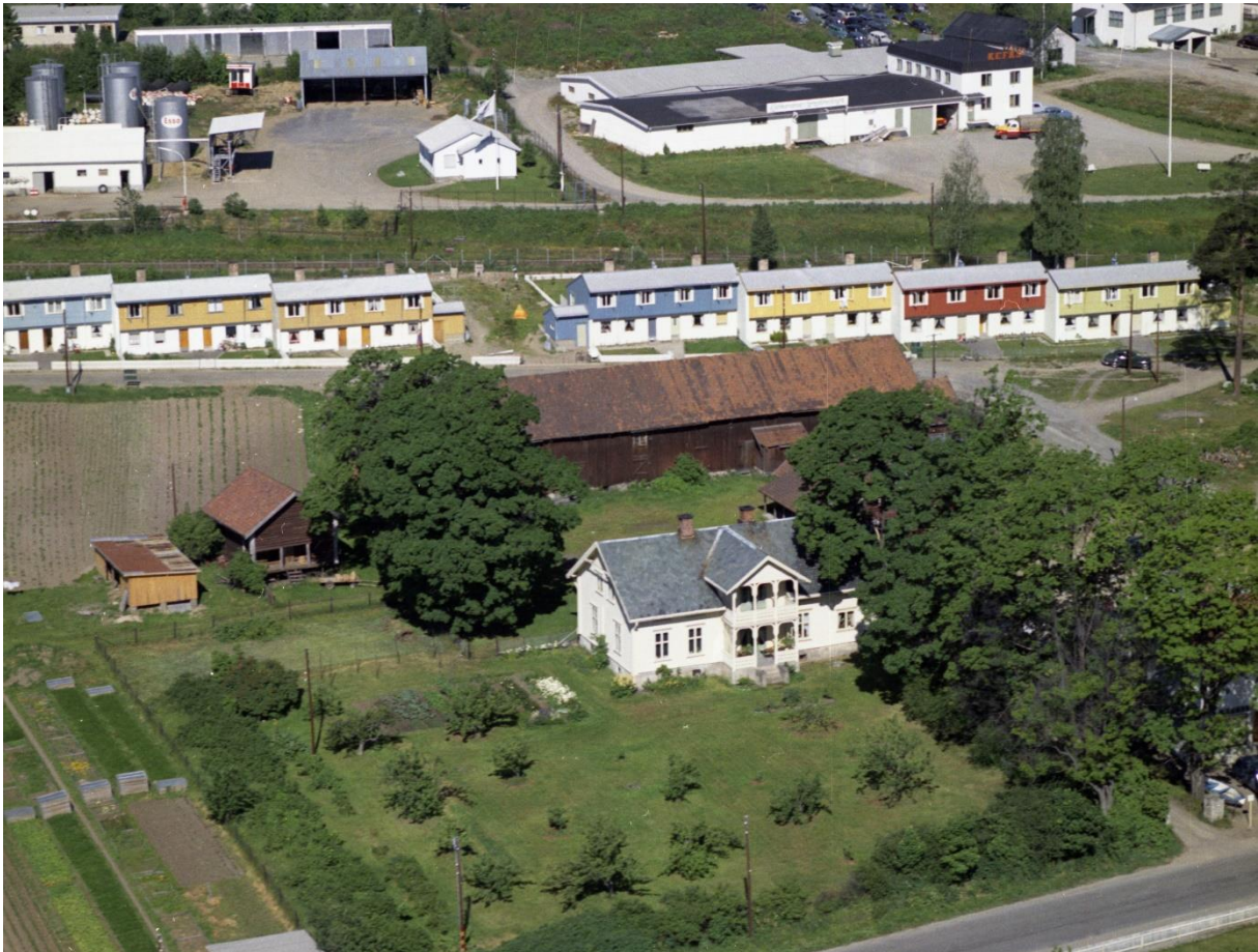
Viken fotografert av Widerøe i 1961.