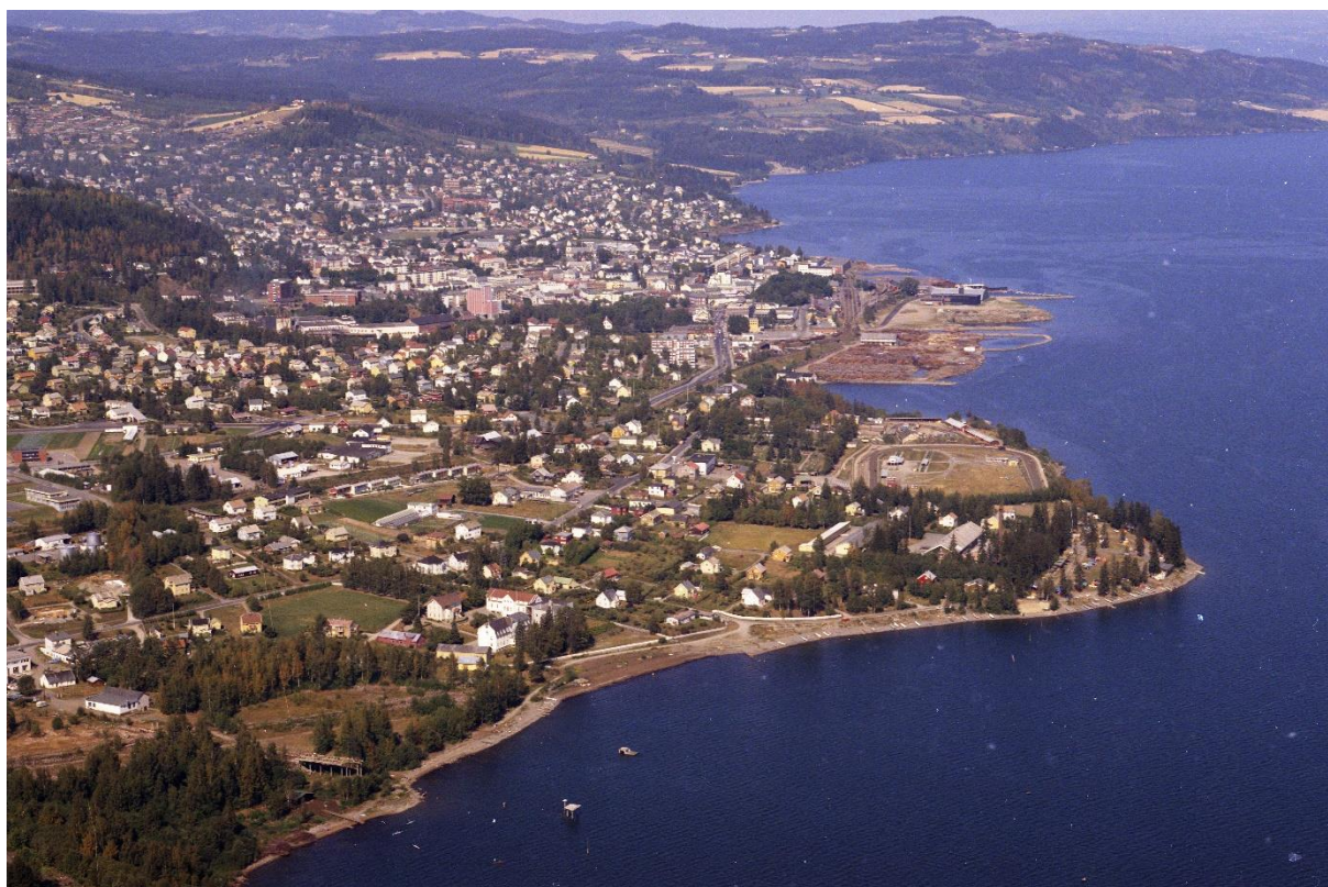
Viken-området sett fra luften i 1961