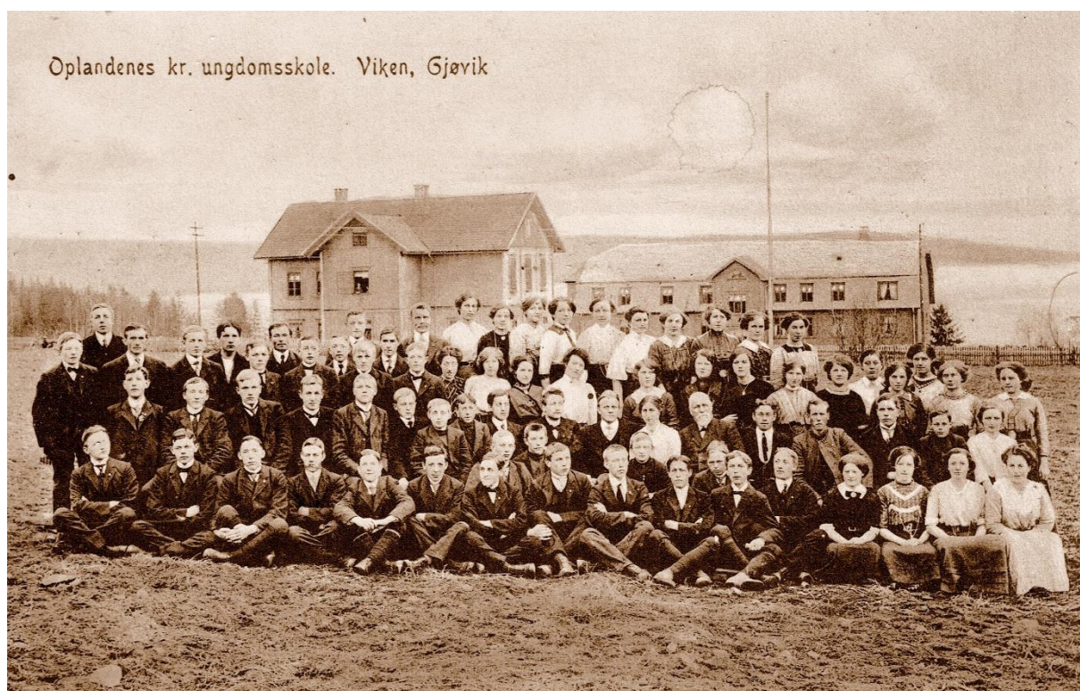
Elevkull foran «Gamleviken» og det nye skolebygget.