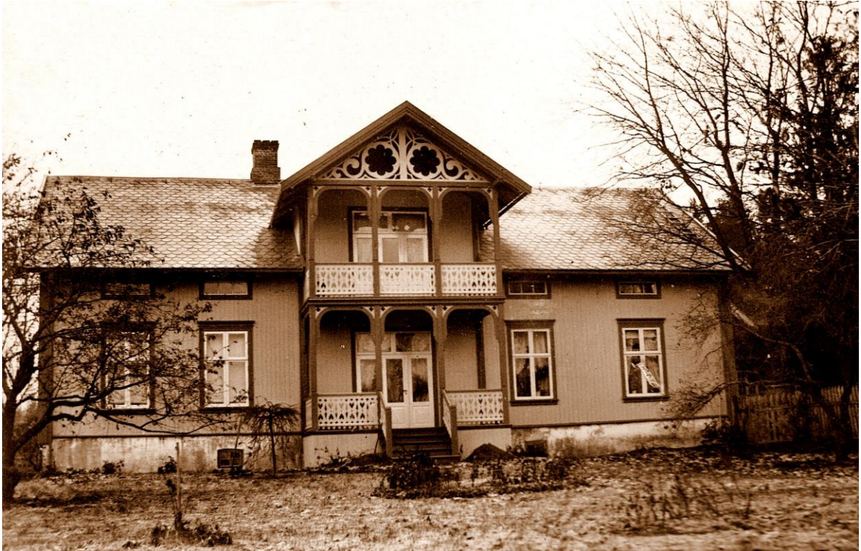
Hovedbygningen på Viken

fikk navnet tilføyet «kristelige». Beliggenheten på Biri ble imidlertid ansett å være for dårlig, og de ville være nærmere Gjøvik.