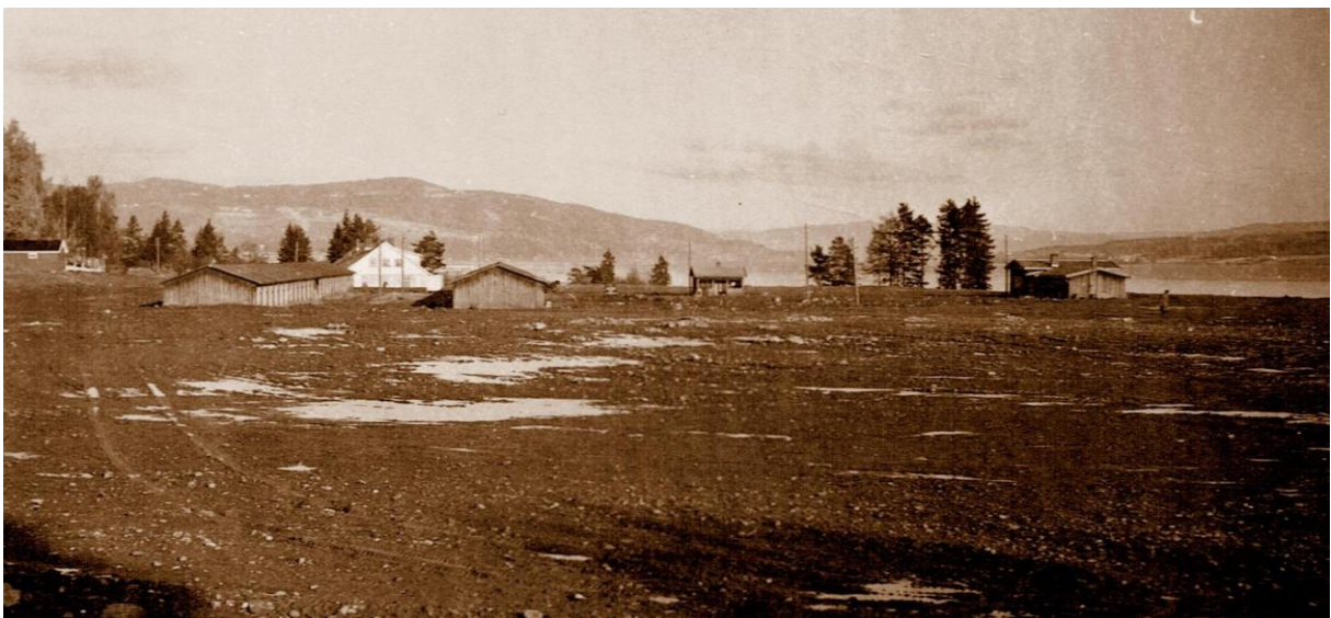
Anleggsområdet for Vikodden travbane våren 1952

Vikengen ble i sin helhet solgt til Gjøvik kommune i 1905 som benyttet en del av arealet til gravplass og lasarett. Det ble også utskilt tomt til bolig for Johan Castberg som kalte eiendommen Fredevik etter sønnen. Huset ble senere benyttet til barnehjem.