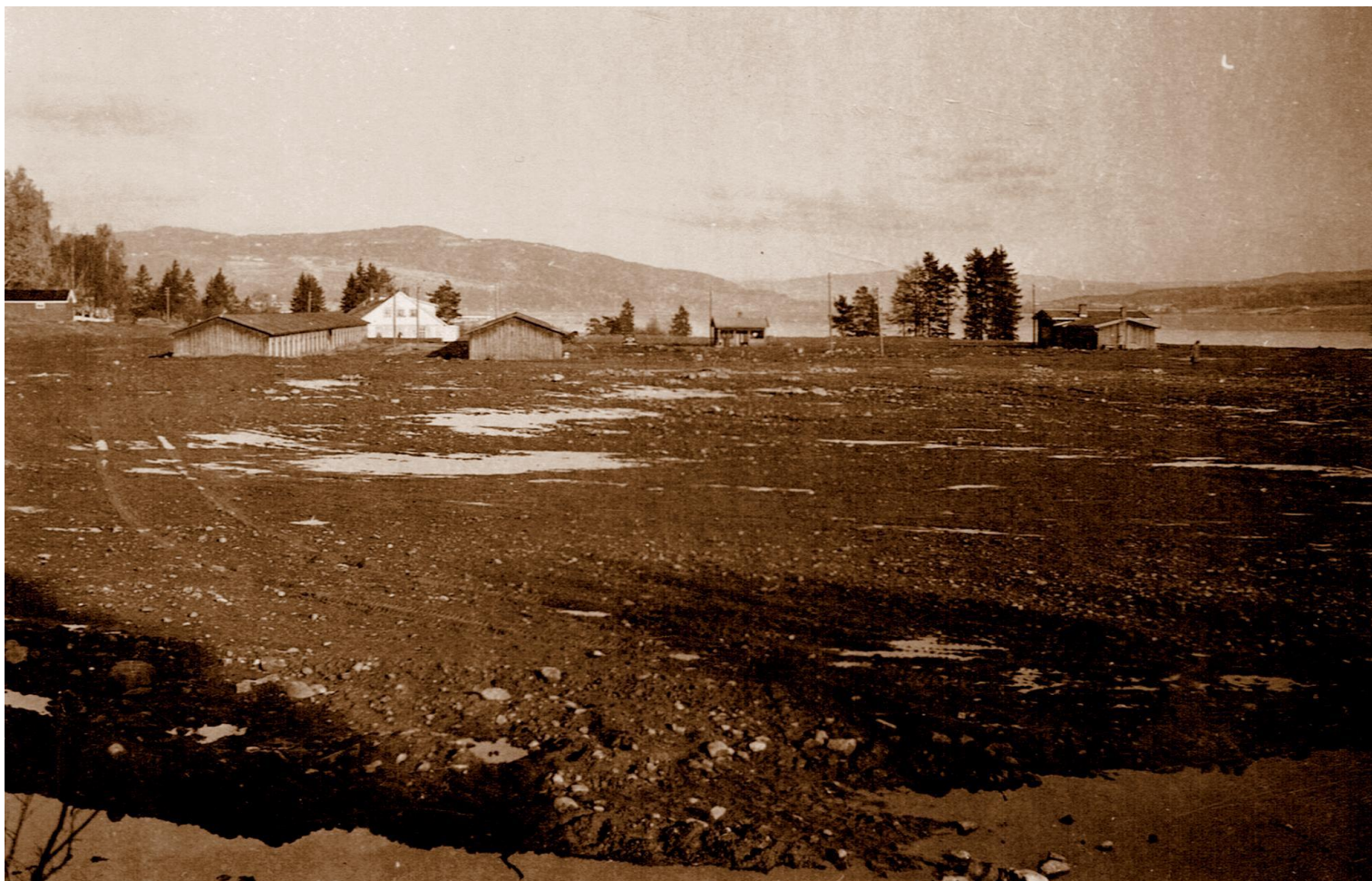
Vikodden travbane var grovplanert våren 1954. Banen ble åpnet i oktober samme år.