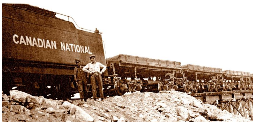
Ludvig arbeidet en tid med bygging av jernbane for Canada National.