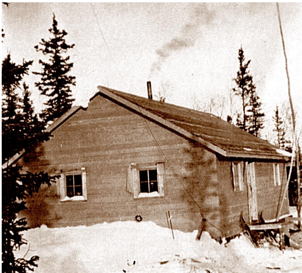
Innkvartering i canadiske skoger