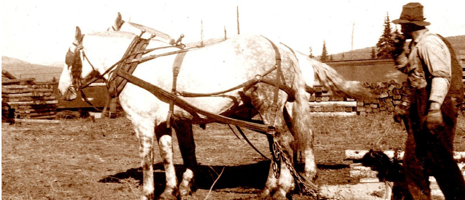
Hesten ble benyttet til transport for jernbanearbeidene.