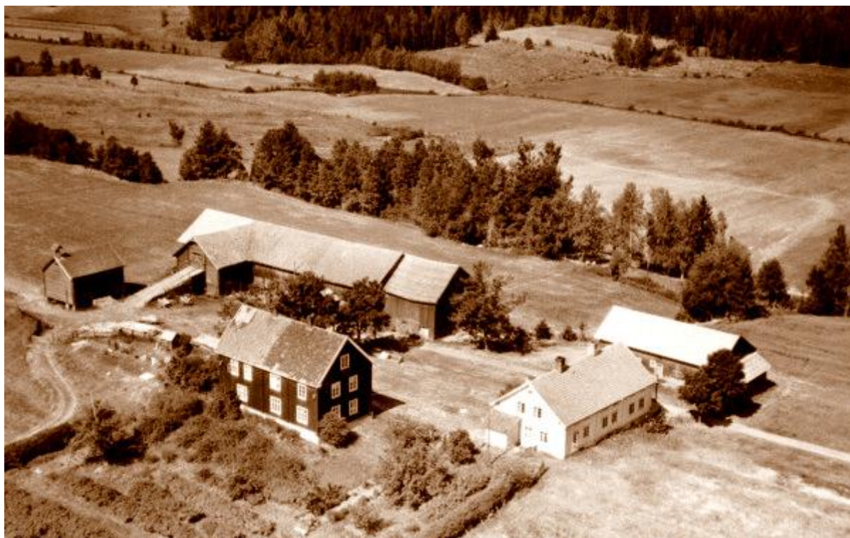
Garden Aas på Østbyhøgda