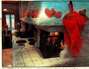
DETALJ: Peiskos også på kjøkkenet, som en integrert del av svartkomfy og elektrisk komfyr.