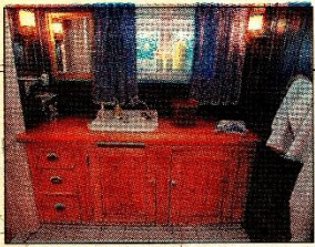
KJØPMANNSDISK: En gammel kjøpmannsdisk gjør ny tjeneste på badet med nedsenket servant.