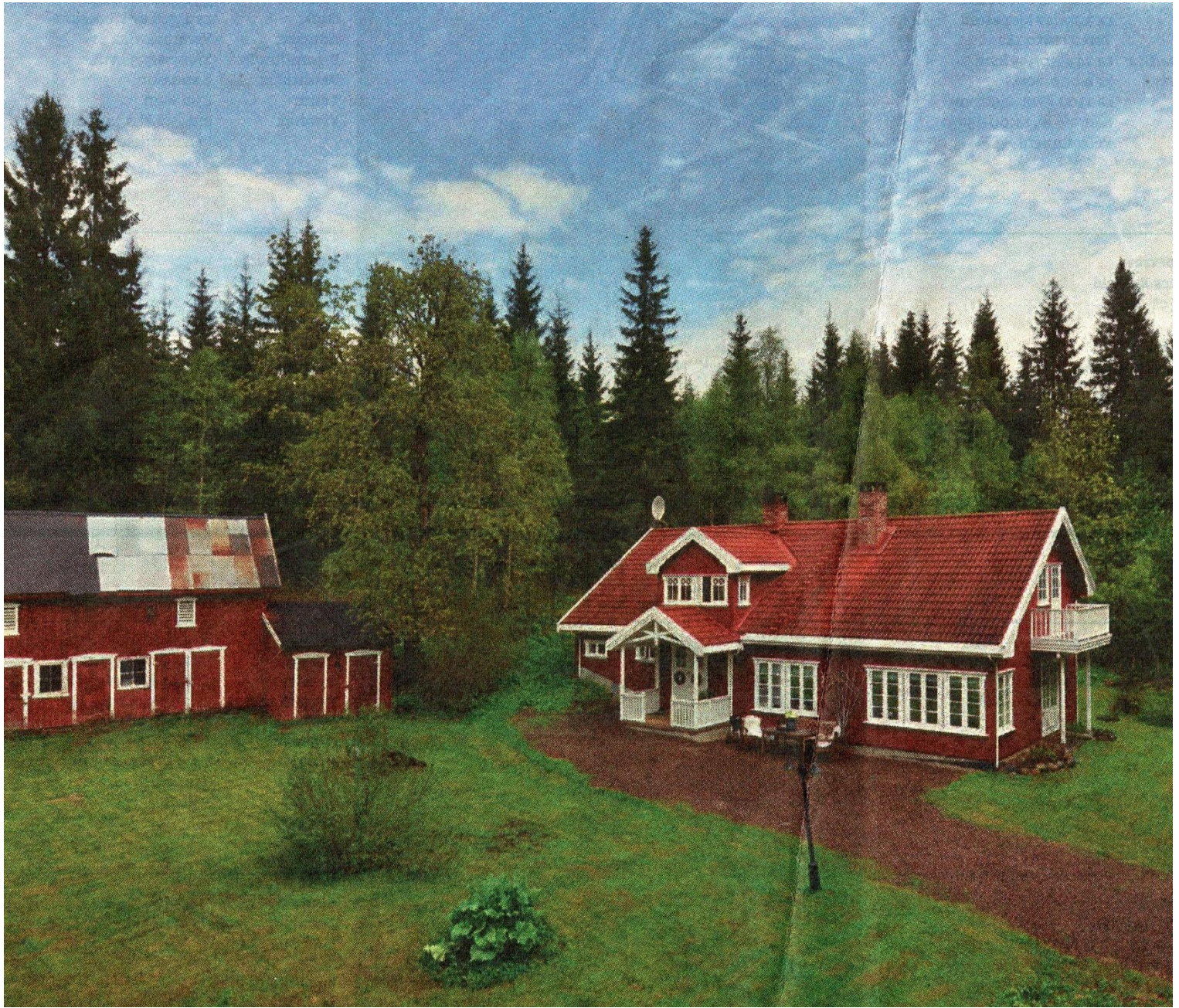
Sæthermoen. Bilde fra salgsprospekt 2013. Huset har fått et vesentlig tilbygg i høyre ende.