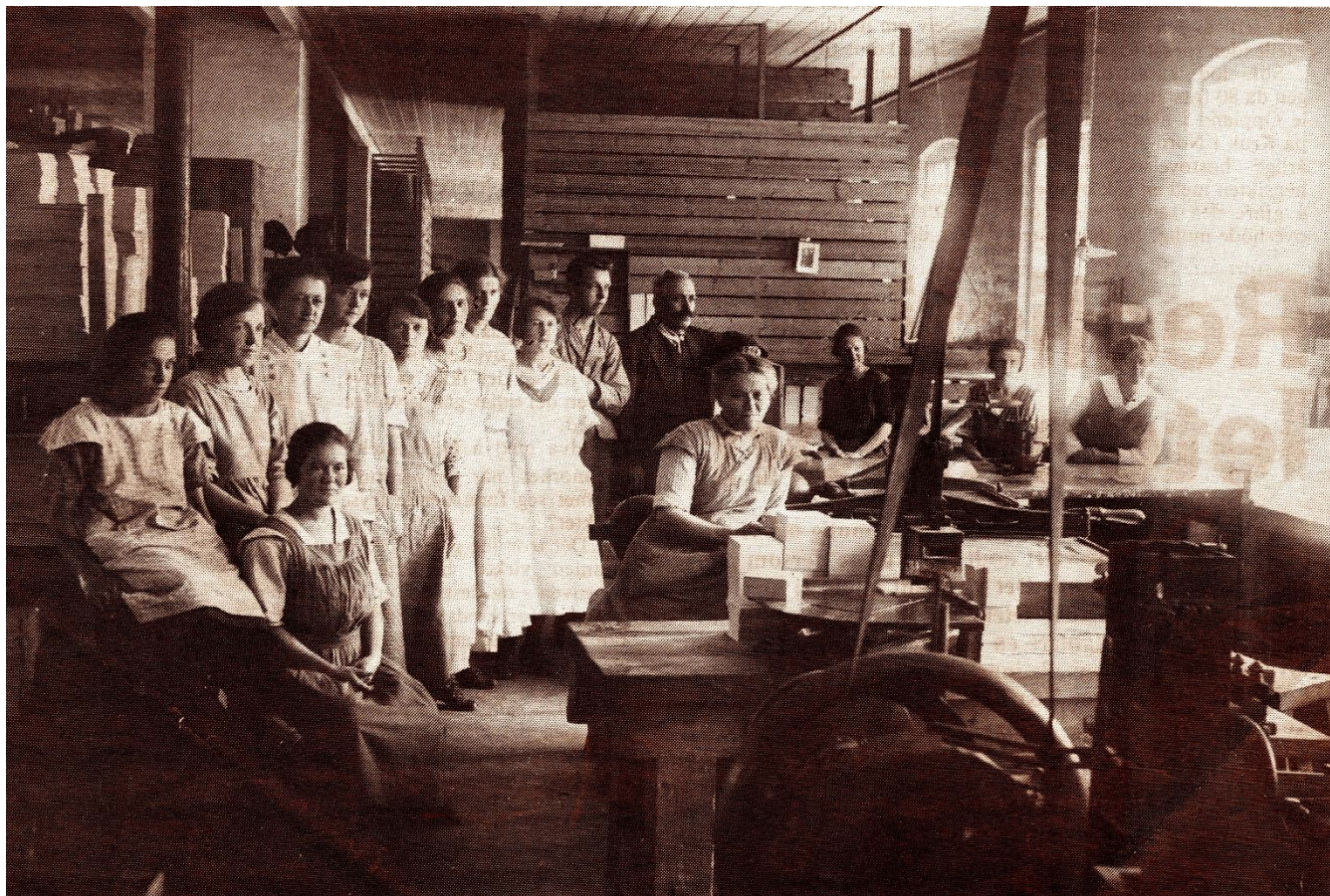
Fra pakkeavdelingen midt på 1920-tallet.